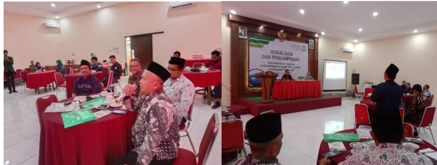
Gambar 2: Sesi Diskusi Peserta dan Pemateri

kesibukan yang padat sehingga adanya perlu koordinasi dan perlu penyampaian materi yang ekstra untuk membuat peserta tetap antusias dalam pemberian materi dan diskusi.