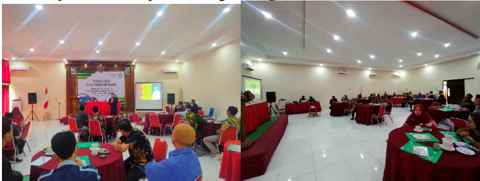
Gambar 1: Sesi Sosialisasi oleh Pemateri

Sebelum melakukan kegiatan penyuluhan, pemateri memperkenalkan diri terlebih dahulu kemudian mencoba menggali pengetahuan dasar tentang kebijakan keuangan hijau. Pemateri memberikan materi mengenai kebijakan keuangan hijau dan penerapannya pada Lembaga Keuangan Mikro Syariah selama 90 menit yang selain membahas materi keuangan hijau, peserta juga melakukan tanya jawab terkait materi dan berbagi pengalaman terkait dengan sistem manajemen LKMS pada masing-masing institusi.