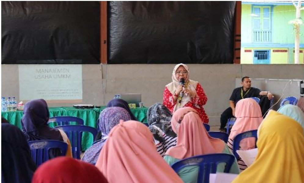
Gambar 3. Pemaparan materi kepada peserta

keterampilan yang dibutuhkan dalam manajemen usaha beserta contoh-contoh penerapannya. Selain menjelaskan materi, pemateri juga memberikan kesempatan kepada para peserta kegiatan untuk berdiskusi dan memberikan pertanyaan mengenai hal-hal yang berkaitan dengan topik kegiatan ataupun di luar topik kegiatan. Hal tersebut bertujuan untuk mempertajam pemahaman mengenai materi yang telah dijelaskan dan mencoba memberikan solusi terhadap permasalahan yang sedang dihadapi oleh para pelaku UMKM di Desa Burai Kabupaten Ogan Ilir.