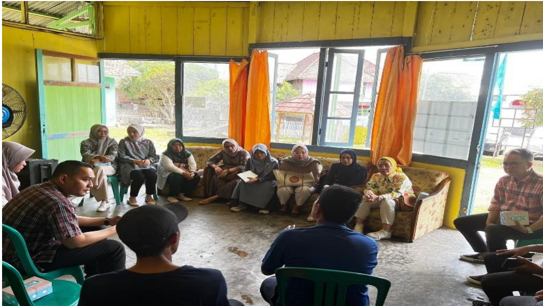
Gambar 2. Survey awal dengan aparatur desa dan perwakilan masyarakat

Hal tersebut dialami oleh para pelaku UMKM di Desa Burai. Masih banyak pelaku UMKM di Desa Burai yang menjalankan usahanya secara seadanya saja. Pelaku UMKM tidak memiliki dasar-dasar dalam mengelola usaha seperti perencanaan usaha, pengalokasian sumberdaya, dan pengawasan terhadap usaha yang dijalankan. Identifikasi masalah ini juga dirumuskan berdasarkan kondisi yang ada pada Desa Burai seperti tingkat pendidikan, pengetahuan, dan keterampilan yang dimiliki oleh sebagian besar masyarakat desa. Setelah masalah yang dihadapi oleh masyarakat desa teridentifikasi, selanjutnya pemilihan khalayak sasaran. Khalayak sasaran yang dipilih adalah para pelaku UMKM yang ada di Desa Burai Kabupaten Ogan Ilir.