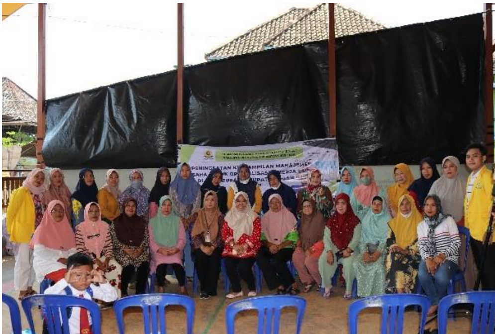
Gambar 4. Foto bersama tim pengabdian masyarakat dengan peserta