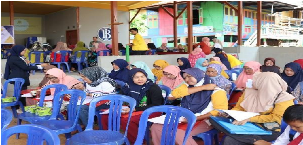
Gambar 5. Evaluasi kegiatan