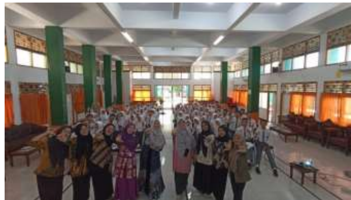
Gambar 4. Foto Bersama Peserta dan Tim Pengabdian

Tahap Kedua dari rangkaian kegiatan pengabdian ini adalah pelatihan pelayanan Kesehatan bagi kader yakni dengan mendampingi kader melakukan pemeriksaan Kesehatan, pemeriksaan IMT dan pembagian tablet tambah darah. Pelayanan Kesehatan merupakan upaya peningkatan, pencegahan, pengobatan dan pemulihan yang dilakukan terhadap peserta didik dan lingkungannya. Pemberian edukasi kepada anak tentang pencegahan penyakit dan pemeliharaan Kesehatan sangat diperlukan sebagai upaya menghambat penyebaran virus di sekolah. (Yanuarti et al., 2022)