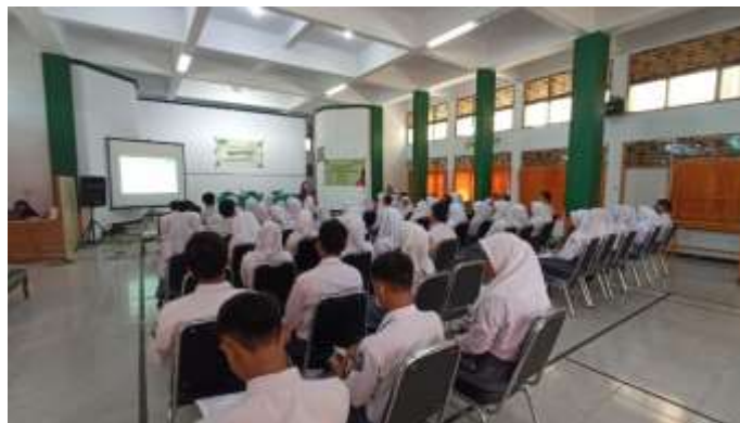
Gambar 3. Penyampaian Materi TRIAS UKS

Penyampaian materi oleh tim diawali dengan pengenalan dan persiapan para peserta. Materi yang disampaikan berupa penjelasan mengenai apa itu UKS dan apa saja kegiatan dari TRIAS UKS. Dengan penyampaian materi ini diharapkan para kader tau tugas dan tanggung jawabnya sebagai kader. Pada sesi diskusi dan tanya jawab, para peserta cukup antusias mengajukan pertanyaan. Untuk mengetahui sejauh mana pemahaman peserta, tim juga memberikan pertanyaan untuk dijawab peserta. Acara diakhiri dengan penyampaian kesimpulan dan pemberian hadiah kepada peserta yang aktif.