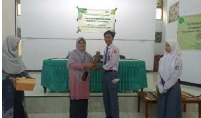
Gambar 3. Pemberian Hadiah kepada Peserta Teraktif

merupakan tahapan awal untuk menambah pengetahuan kader sebagai bekal menerapkan trias uks di sekolah. Pengabdian sebelumnya pernah dilakukan oleh (Melliza, 2021) tentang revitalisasi UKS di SMP Muhammadiyah Malang menunjukkan hasil bahwa ada peningkatan pengetahuan sebelum dilakukan pelatihan. Pengabdian dalam bentuk penyuluhan bidang Kesehatan telah mampu menumbuhkan kreativitas dan juga motivasi untuk menjaga serta menerapkan pola perilaku hidup bersih dan sehat dalam menjaga Kesehatan individu maupun anggota keluarga dan masyarakat. (Noorhidayah et al., 2023)