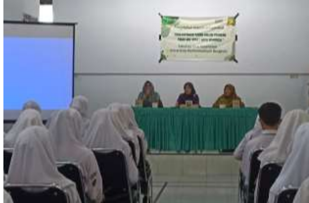
Gambar 2. Kata Sambutan Pembina UKS

Tahap pertama kegiatan adalah edukasi tentang TRIAS UKS kepada seluruh kader. Kegiatan diawali dengan proses registrasi peserta pada pukul 07.30 WIB. Pembukaan kegiatan dimulai dengan kata sambutan oleh guru Pembina UKS yang mewakili pihak sekolah, disampaikan juga tujuan dari kegiatan ini secara umum.