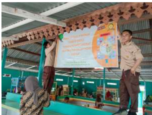
Gambar 6. Pemasangan Spanduk Kantin Sehat

Tahap ketiga dari pelatihan TRIAS UKS adalah pembinaan lingkungan sekolah sehat yakni bersama kader mensosialisasikan lingkungan kantin sehat melalui pemasangan spanduk di area kantin sekolah.