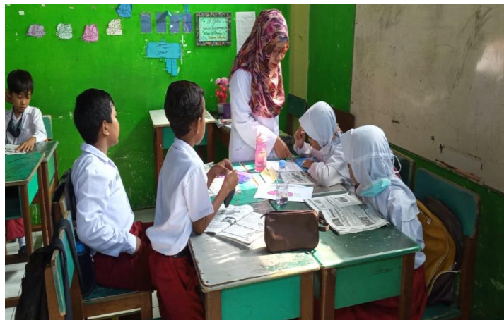
Gambar 6. Praktik Mengajar Skenario MIKIR di Kelas 4

Dalam pembelajaran situasi tempat duduk yang di buat oleh guru menggunakan kelompok diskusi, guru menggunakan media gambar dalam bentuk kertas sebagai penjelasan ciri-ciri dari bunga sempurna. Guru menggunakan sumber belajar bergambar untuk materi pembelajaran IPA (ciri-ciri bunga sempurna) dan penguat tambahan menggunakan LKS (Lembar Kerja Siswa), mengajak siswa untuk menjawab hasil diskusi dari pertanyaan yang diberikan oleh guru, dan memberikan kesempatan siswa untuk bertanya, apakah siswa tersebut paham atau tidak terhadap materi yang disampaikan oleh guru?