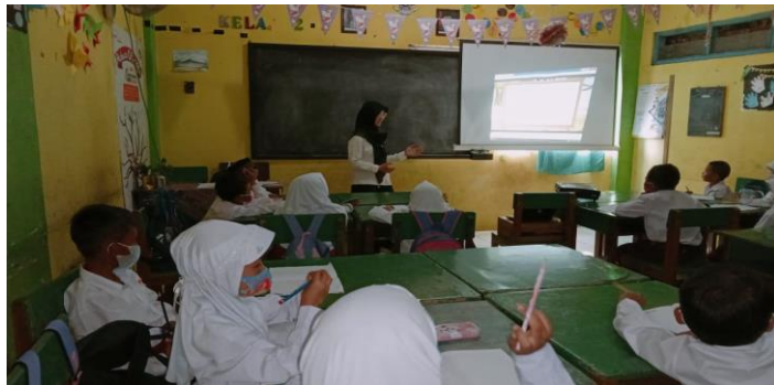
Gambar 4. Praktik Mengajar Skenario MIKIR di Kelas 2

pertanyaan yang dilontarkan siswa, memberi apresiasi dan masukan kepada siswa yang telah menceritakan pengalaman dan membaca teks di depan.