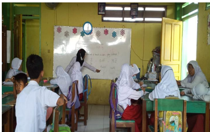
Gambar 9. Praktik Mengajar Skenario MIKIR di Kelas 6

mendapat respon yang baik dan siswa mampu untuk menjawab pertanyaan yang diberikan oleh guru, mengajak siswa untuk berfikir dengan memberikannya soal latihan. Dalam pembelajaran situasi di dalam kelas menggunakan sistem kelompok atau meja diskusi. Dalam pembelajaran menggunakan hasil diskusi yang dikerjakan oleh siswa. Pembelajaran menggunakan kertas post it agar siswa tertarik dalam pembelajaran, mengajak siswa untuk menjawab hasil pertanyaan yang diberikan oleh guru. Guru memberikan kesempatan siswa untuk bertanya, apakah siswa tersebut paham atau tidak terhadap materi yang diberikan?