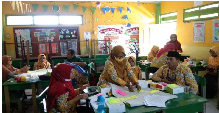
Gambar 2. Peserta Menyelesaikan Tugas Kelompok Merumuskan Pertanyaan Produktif, , Imajinatif dan Terbuka

Setelah selesai materi mengembangkan pertanyaan/tugas dan lembar kerja, materi berikutnya yang disampaikan oleh Narasumber adalah praktik mengajar selama 720 menit. Kegiatan pada materi ini diantaranya peserta dibagi menjadi beberapa kelompok tim pengajar untuk menyusun skenario MIKIR, setelah itu melakukan simulasi mengajar, menyusun RPP dan lembar kerja, praktik mengajar di kelas dan penulisan refleksi mengajar.