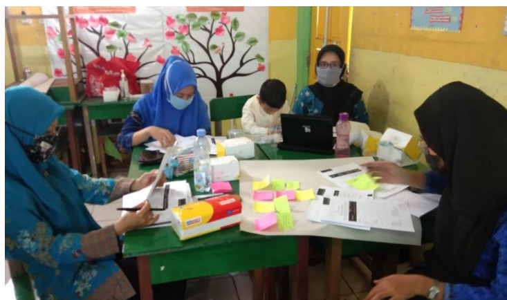
Gambar 1. Peserta menuliskan hasil pengamatan

Peserta diminta untuk mengamati video pada materi pembelajaran aktif MIKIR kemudian menuliskan hasil pengamatannya dikertas metaplan yang sudah disediakan di meja kelompok masing-masing. Setelah itu hasil pengamatan disimpan dan diletakkan ditengah meja masing-masing kelompok.