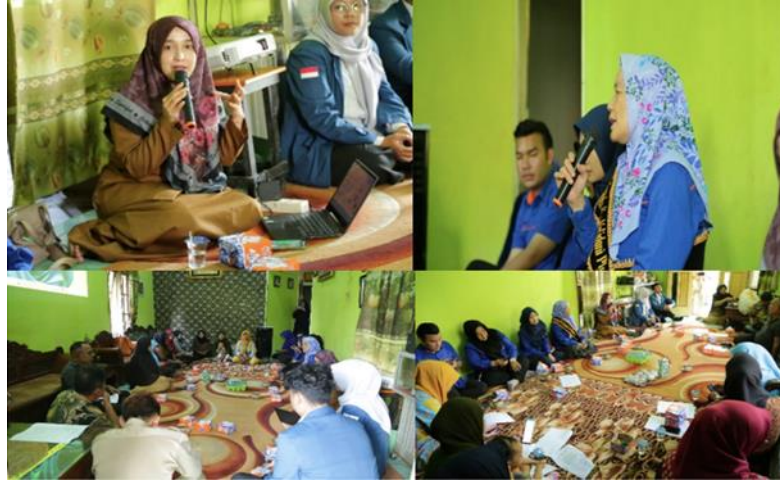
Gambar 2 Penampakan saat penyampaian materi

dokumen data dengan baik dan menarik untuk dibaca. Berikut adalah beberapa penampakan saat penyampaian materi dengan metode ceramah kepada semua peserta: