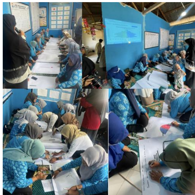
Gambar 3 Penampakan saat praktek pengelolaan dan penyajian data

Selanjutnya, kegiatan pendampingan teknis dilakukan dengan metode tutorial atau pendampinga kepada peserta. Pada kegiatan ini peserta dibagikan lembar kerja praktek, alat dan bahan yang dibutuhkan untuk menyajikan data kependudukan. Adapun tujuan dari pelaksanaan kegiatan ini ialah peserta membuat tabel dan mengelola data dengan menggabungkan data yang di dapat sekaligus praktek menyajikan data dalam bentuk diagram batam. Data yang diolah oleh peserta merupakan data diperoleh dari rumahdataku.bkkbn.go.id yang berkaitan dengan data kependudukan di Desa/Kelurahan Sei Selincah. Berikut ini adalah beberapa penampakan praktek pengelolaan dan penyajian data: