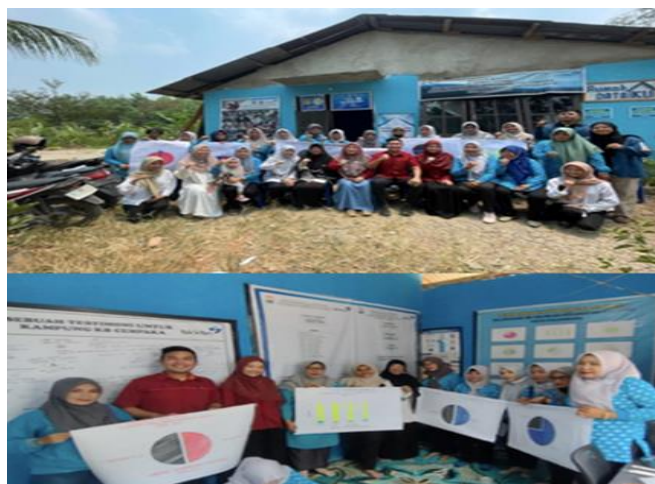
Gambar 4 Dokumentasi pasca kegiatan (Hasil pelaksanaan, 2023)

Cempaka serta dokumen perjanjian kerja sama terkait pelaksanaan tridharma perguruan tinggi dan program Merdeka Belajar Kampus Merdeka. Dokumen ini menjadi dasar hukum yang mengikat kedua belah pihak dan memastikan keterlibatan yang berkelanjutan dalam kegiatan pengabdian kepada masyarakat