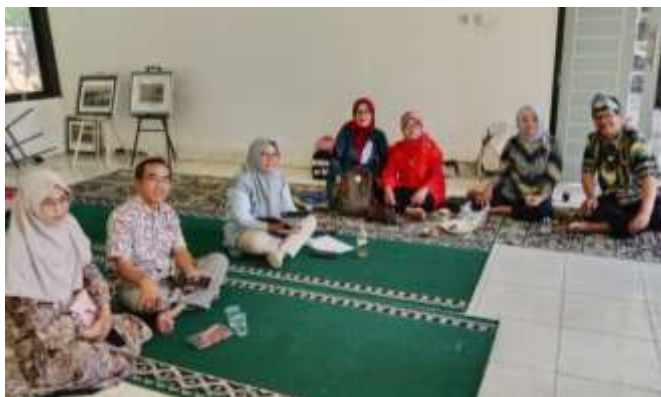
Gambar 4. Evaluasi kegiatan pelatihan Tanjak oleh tim pelaksana