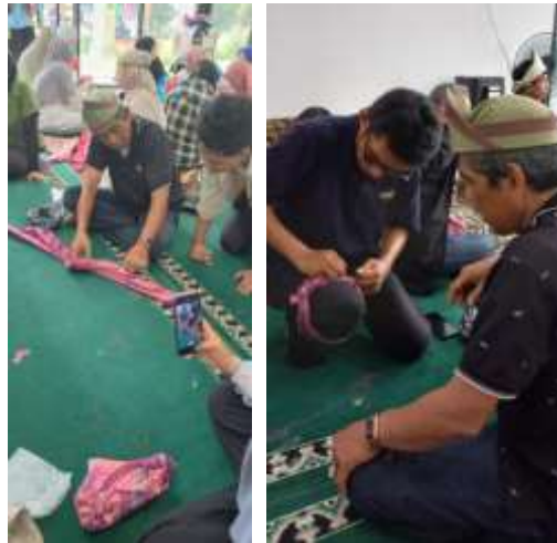
Gambar 8. Produk Tanjak yang dihasilkan oleh peserta pelatihan

kenyamanan dan kesesuaian yang optimal bagi setiap individu yang mengenyakannya.