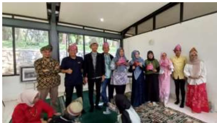
Gambar 9. Produk Tanjak yang dihasilkan oleh peserta pelatihan

Tanjak hasil pelatihan merupakan produk yang dihasilkan melalui teknik lipatan dan ikatan tradisional. Setiap Tanjak dibuat dengan cermat agar bagi pemakainya merasa nyaman. Berikut ini adalah hasil pelatihan Tanjak dari masing-masing peserta.