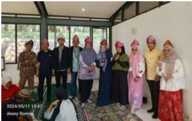
Gambar 5. Hasil Tanjak yang dibuat oleh peserta

Secara keseluruhan, kualitas hasil Tanjak dari kegiatan pelatihan untuk peserta sudah cukup berhasil, dengan setiap peserta mampu menyelesaikan pembuatan Tanjak dengan baik. Meskipun beberapa lipatan masih kurang rapi, hal ini wajar mengingat pelatihan ini merupakan tahap awal.