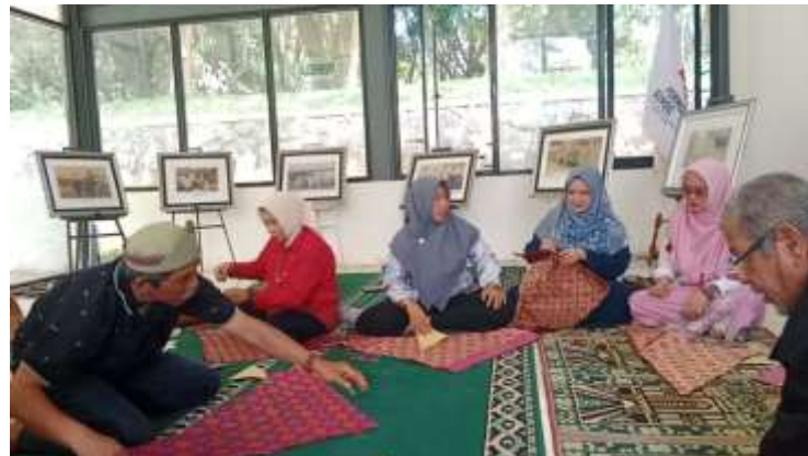
Gambar 7. Peserta menjahit bahan dasar songket Tanjak yang sudah dilipat

Peserta memahami bahwa dalam proses pembuatan lipatan dasar Tanjak dari bahan songket, langkah kedua yang harus dilakukan adalah membalikkan bahan tersebut. Hal ini penting untuk memastikan lipatan dasar Tanjak terbentuk dengan rapi dan sesuai dengan teknik tradisional yang benar. Tujuan dari langkah ini juga adalah untuk menjahit atau menjulur benang guna mengikat kedua sisi lembaran kain songket tersebut.