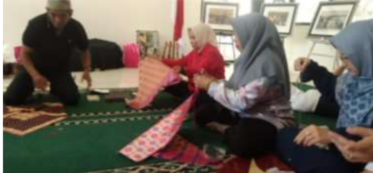
Gambar 6. Peserta pelatihan melipat kain songket sebagai bahan dasar Tanjak

Proses dasar pembuatan Tanjak ini dimulai dengan memotong bahan menjadi bentuk persegi berukuran 90 cm x 90 cm. Setelah itu, dua sisi kain songket tersebut disatukan. Sehingga terbentuk bidang kain segitiga yang simetris dan rapi. Langkah ini merupakan dasar penting untuk memastikan Tanjak terbentuk dengan baik sesuai dengan tradisi yang benar.