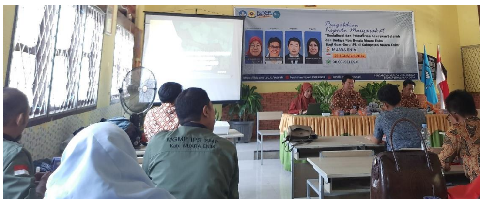
Gambar 1 Penyampaian Materi Sosialisasi tim pengabdian

Setelah dilakukan pretest kegiatan sosialisasi dilanjutkan dengan pemaparan materi yang disampaikan melalui slide power point yang divariasikan dengan diskusi interaktif oleh tim pengabdian.