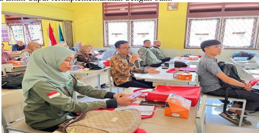
Gambar 2 Tanya jawab dan diskusi

Kegiatan dilanjutkan dengan diskusi dan tanya jawab dari peserta, selain itu peserta juga menyampaikan kesan serta tanggapannya terhadap langkah-langkah praktis yang akan mereka ambil kedepannya agar materi yang didapat pada kegiatan Sosialisasi Pelestarian Kekayaan Sejarah dan Budaya Non Benda bagi Guru IPS di Muara Enim dapat terimplementasikan dengan baik.