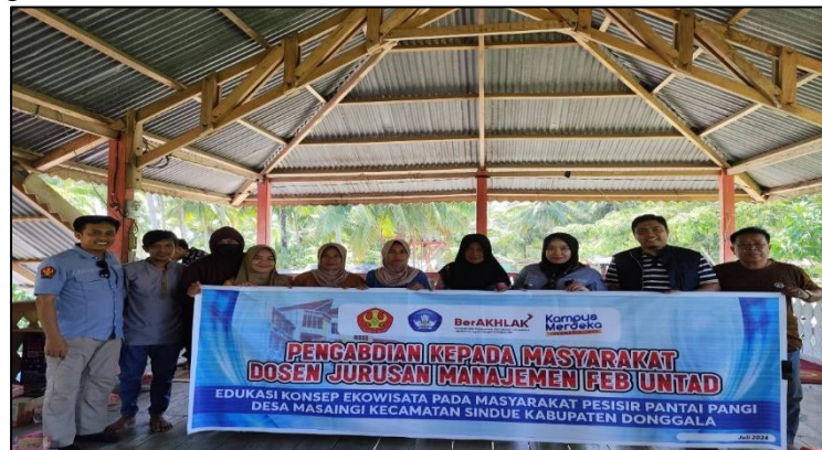
Gambar 1 Pelaksanaan Kegiatan PkM

UMKM juga diajarkan cara mengembangkan produk yang ramah lingkungan, termasuk penggunaan bahan alami dan pengemasan yang dapat didaur ulang. Inisiatif ini mendukung pernyataan dari Manea dan Cozea. (2023) Mengintegrasikan faktor lingkungan dan ekonomi dalam pariwisata berkelanjutan dapat mendorong pertumbuhan ekonomi tanpa merusak lingkungan..