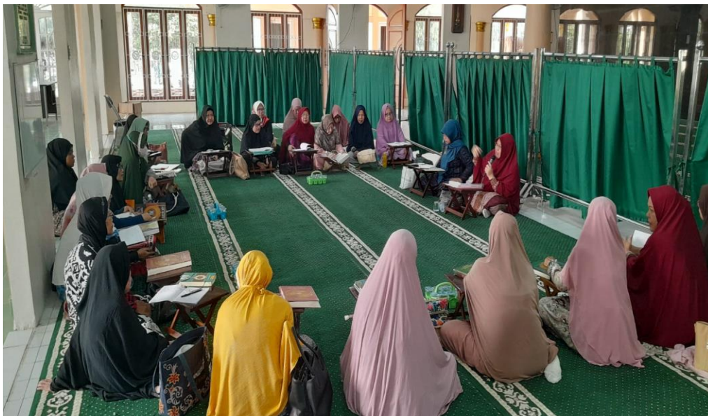
Gambar 3. Diskusi Inter Aktif