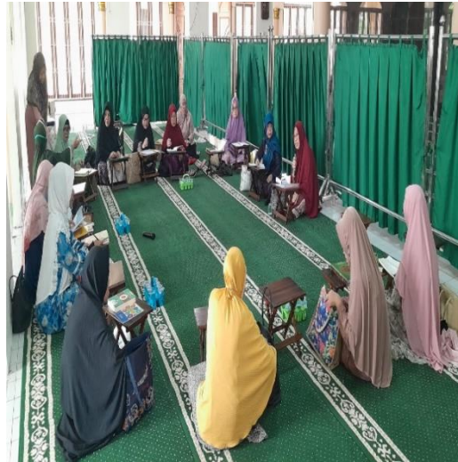
Gambar 1 dan 2 Tempat kajian dan Berlangsungnya Pemberian Materi