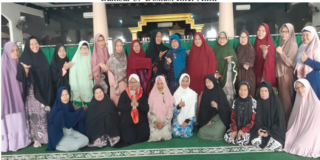
Gambar 4. Dengan Para Jamaah Majelis Pengajian