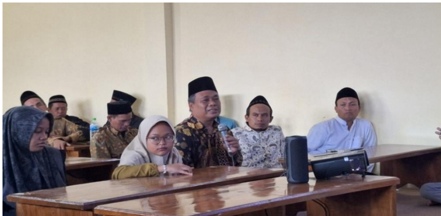
Gambar 3: Feedback Dari Peserta Seminar

dalam penelitian yang dilakukan oleh Miftachuddin (2021) yang menyatakan bahwa pemberdayaan literasi wakaf pada lembaga pendidikan Islam sangat dibutuhkan untuk mengoptimalkan potensi ekonomi dan sosial wakaf. Sebagai bentuk tindak lanjut, pengurus pondok menyampaikan permintaan akan adanya pendampingan berkelanjutan, khususnya dalam aspek legalitas aset wakaf. Mereka menyadari bahwa salah satu kendala utama dalam pengelolaan wakaf adalah belum tertibnya aspek hukum, seperti sertifikasi tanah dan pencatatan administratif, yang berpotensi menimbulkan sengketa di masa depan. Selain itu, pengurus juga mengusulkan agar pihak kampus menjadikan Pondok Pesantren Manbaul Ulum sebagai mitra permanen sekaligus lokasi magang bagi mahasiswa dalam bidang manajemen aset wakaf. Usulan ini memperlihatkan antusiasme dan komitmen pesantren untuk terus berkembang sebagai pusat literasi wakaf berbasis komunitas. Menurut Afif, Awalia, Kamaluddin, & Rusli (2025) kemitraan antara perguruan tinggi dan lembaga lokal dalam program pengabdian dapat membentuk ekosistem pendidikan yang kolaboratif dan berkelanjutan, terutama dalam pengembangan wakaf produktif.