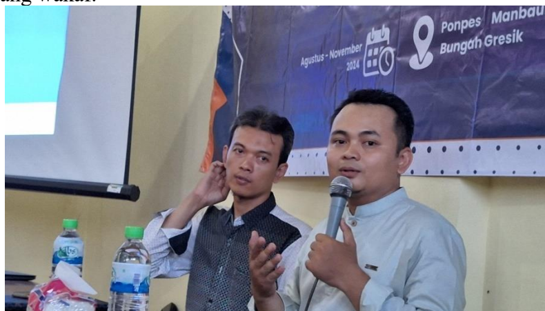
Gambar 1: Kegiatan Hari Pertama