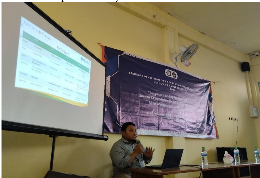
Gambar 2: Kegiatan Hari Kedua