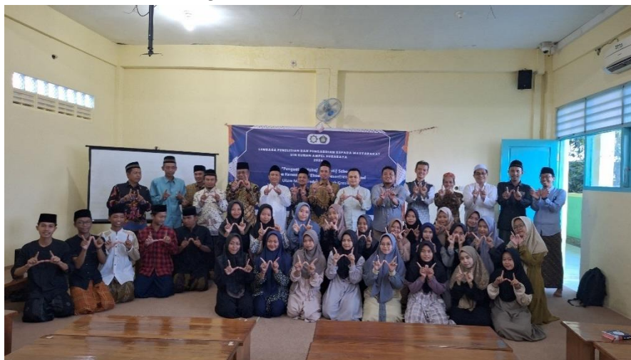
Gambar 4: Kegiatan Penutupan

Secara keseluruhan, program ini tidak hanya memberikan pemahaman teoritis, tetapi juga mendorong pengurus pesantren untuk berpikir kreatif dalam memanfaatkan aset wakaf. Pelatihan ini menimbulkan manfaat jangka panjang dengan adanya rencana bisnis yang bisa diaplikasikan langsung di lapangan,