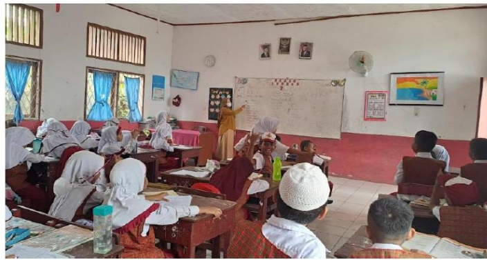
Gambar 1. Pelaksanaan Pelatihan

Materi pelatihan dalam kegiatan ini mencakup berbagai elemen dasar dalam bahasa Inggris yang dirancang untuk memperkenalkan kosakata umum kepada peserta secara menyeluruh. Evaluasi dapat dilakukan dengan melihat sejauh mana kemampuan peserta kegiatan mengucapkan kata-kata dengan benar serta memiliki artikulasi dan intonasi yang tepat terkait topik yang telah dipelajari meliputi pengenalan huruf alfabet, angka, warna, serta nama-nama hari dan bulan dalam bahasa Inggris. Selain itu, peserta juga diperkenalkan pada penggunaan kata ganti ( pronouns ) dan berbagai jenis kata benda ( nouns ), seperti nama-nama hewan, benda di sekitar, sayur-sayuran, dan buah-buahan. Untuk menguji peningkatan jumlah kosakata yang dimiliki peserta, pelaksanaan pre-test dan post-test menjadi instrumen utama. Berikut ini adalah hasil dari pre-test dan post-test yang diikuti oleh seluruh peserta namun terdapat 6 peserta kegiatan yang tidak mengikuti keseluruhan tes, sehingga tidak dimasukkan pada grafik hasil dibawah ini: