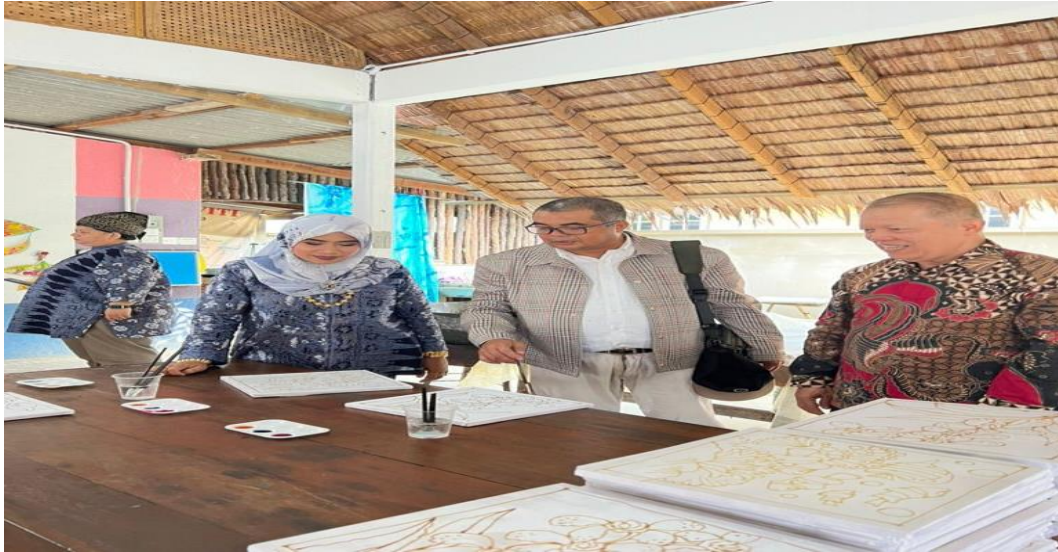
Gambar.5 Foto Bersama Tim Pengabdian Masyarakat Internasional UIR di Kampus Unisza Tahun 2024.

Green tourism atau disebut dengan pariwisata hijau adalah kegiatan pariwisata yang ramah lingkungan dan berkelanjutan. Konsep ini bertujuan untuk menjaga kelestarian lingkungan dan budaya lokal, serta mendukung kesejahteraan masyarakat setempat. Prinsip Green Tourism Menjaga dan melestarikan alam, Meminimalkan dampak negatif terhadap alam, Mendukung kesejahteraan komunitas setempat, Memberdayakan sosial budaya ekonomi masyarakat lokal, Memberikan kontribusi bagi perekonomian masyarakat lokal. Green tourism juga mendorong pengunjung untuk menghormati dan menjaga lingkungan sekitar mereka, seperti tidak membuang sampah sembarangan dan tidak merusak flora dan fauna lokal. Dengan menerapkan praktik-praktik ini, wisata hijau dapat membantu menjaga keberlanjutan lingkungan dan mengurangi efek negatif yang ditimbulkan oleh pariwisata.