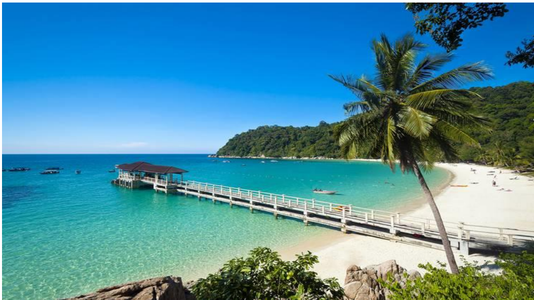
Gambar 4. Objek Wisata Pulau Perhentian, Terengganu, Malaysia 2024.

Bagi para penggemar aktivitas alam, Terengganu memiliki berbagai tempat wisata dengan aktivitas seperti menyelam, snorkeling, dan memancing di perairan yang kaya akan kehidupan laut. Kamu juga dapat menikmati keindahan alam dengan menjelajahi hutan-hutan hijau dan air terjun yang menakjubkan di sekitar daerah ini. Berikut rekomendasi tempat wisata Terengganu yang dapat menjadi referensi jika ingin berkunjung ke sana. Berikut keindahan alam yang ada di Terengganu, Malaysia.