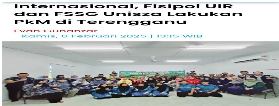
Dekan FSSG UNISZA (tengah) bersama sejumlah dosen dari Fisipol UIR dan FSSG Universiti Sultan Zainal Abidin (UNISZA) foto bersama usai kegiatan pengabdian kepada masyarakat. (FISIPON UIR UNTUK RIAUPOS.CO)

Secara teknis kegiatan pengabdian masyarakat ini di ikuti oleh beberapa Program Studi di Lingkungan UIR yaitu diantaranya Prodi Ilmu Pemerintahan, Prodi Ilmu Administrasi Bisnis, Prodi Hubungan Internasional, Prodi Administrasi Bisnis dan Prodi Kriminologi yang dibentuk beberapa tim sesuai bidang keilmuan dan menetapkan tema kegiatan sesuai isu dan permasalahan mitra salah satunya tema Strategi Pengembangan Pariwisata Berkelanjutan Melalui Green Tourism di Negara Bagian Terengganu, Malaysia di Terengganu. Kegiatan pengabdian masyarakat ini dilaksanakan selama dua hari yaitu tanggal 06-10 Oktober 2024 di Terengganu, Malaysia. Dikarenakan kegiatan pengabdian masyarakat ini merupakan kegiatan kolaborasi maka kegiatan awal yang dilakukan adalah melakukan kunjungan ke Universiti Sultan Zainal Abidin (UniSZA) Malaysia.