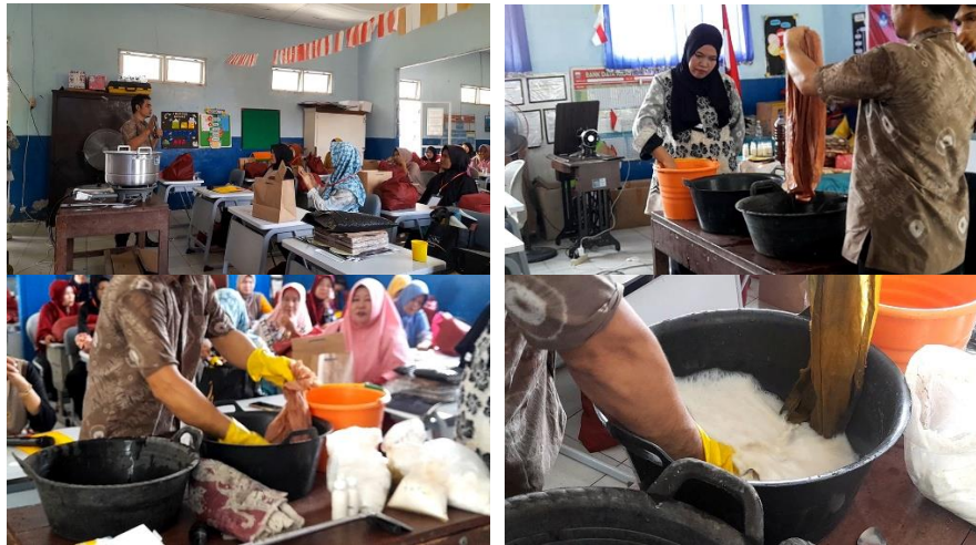
Gambar 1. Pelatihan Pewarna Alam

Kedua , Pelatihan Branding Identity dan Packaging bertujuan untuk meningkatkan daya tarik visual dan identitas usaha mitra. Dalam pelatihan ini, mitra mendapatkan pendampingan dalam merancang elemen visual usaha, termasuk pembuatan logo, desain kemasan, dan media promosi grafis baik cetak maupun digital. Proses branding dilakukan agar mitra memiliki citra usaha yang khas dan berakar pada nilai-nilai lokal, serta dapat meningkatkan nilai jual produk secara signifikan. Dengan identitas usaha yang lebih profesional dan menarik, mitra diharapkan mampu menyesuaikan diri dengan dinamika pasar yang semakin kompetitif.