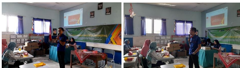
Gambar 3. Pelatihan Digital Marketing

Ketiga , Pelatihan Digital Marketing difokuskan pada perluasan jangkauan pemasaran melalui pemanfaatan teknologi informasi. Mitra diperkenalkan pada platform digital seperti media sosial, marketplace, dan teknik promosi daring untuk meningkatkan visibilitas produk mereka. Dengan pelatihan ini, diharapkan mitra tidak lagi bergantung pada metode pemasaran tradisional seperti titip jual di toko lokal, melainkan mampu menjangkau konsumen di tingkat kota bahkan nasional. Pemanfaatan media digital membuka peluang pasar baru, mengatasi keterbatasan geografis, serta mendukung efisiensi promosi.