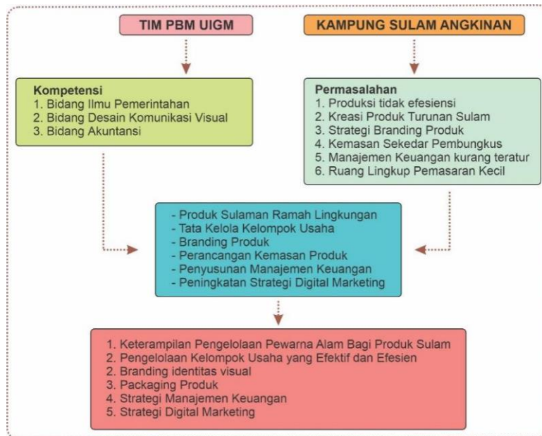
Gambar 1. Metode Pelaksanaan PBM, Tim PBM dan Kelompok Usaha Sulam Angkinan. Sumber: diolah oleh Penulis, 2025.