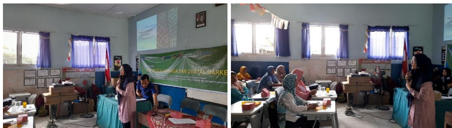
Gambar 5. Pelatihan Tata Kelola Kelembagaan

Kelima , Pelatihan Tata Kelola Kelembagaan bertujuan untuk membekali mitra dengan pemahaman tentang pentingnya sistem manajemen organisasi yang efisien dan akuntabel. Sesi ini mencakup penyusunan struktur organisasi, perumusan Anggaran Dasar dan Anggaran Rumah Tangga (AD/ART), serta penyusunan Standar Operasional Prosedur (SOP) yang relevan dengan kegiatan usaha. Selain itu tim juga membantu pembuatan Nomor Induk Berusaha (NIB) anggota kelompok sunan dan HaKi. Tata kelola yang baik akan memperkuat posisi kelembagaan komunitas perajin, meningkatkan profesionalisme, serta mempermudah dalam pengambilan keputusan dan kerjasama lintas sektor.