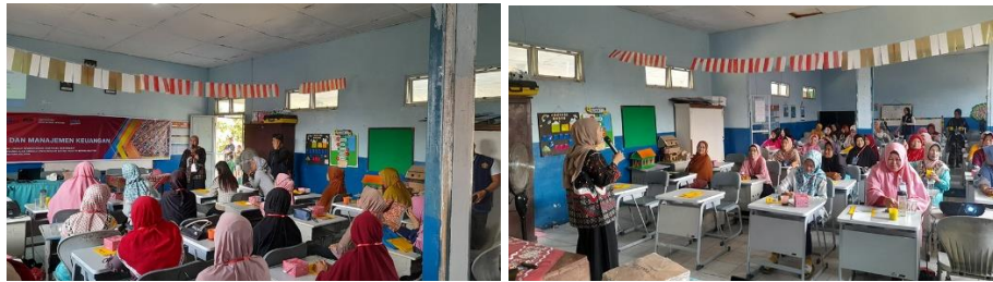
Gambar 4. Pelatihan Manajemen Keuangan

Keempat , Pelatihan Manajemen Keuangan diselenggarakan untuk mengatasi kelemahan mitra dalam mengelola keuangan usaha rumah tangga atau skala UMKM. Materi pelatihan mencakup pemahaman dasar tentang pencatatan keuangan, perencanaan modal, penyusunan anggaran, penghitungan produktivitas, dan penilaian aset usaha. Kegiatan ini dilaksanakan dengan pendekatan pendampingan agar peserta mampu memahami praktik keuangan secara langsung dan aplikatif. Hasil yang diharapkan adalah peningkatan kemampuan mitra dalam merencanakan dan mengendalikan keuangan usaha secara sistematis dan berkelanjutan.