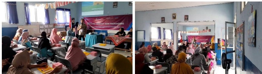
Gambar 2. Pelatihan Branding Identity dan Packaging

Kedua , Pelatihan Branding Identity dan Packaging bertujuan untuk meningkatkan daya tarik visual dan identitas usaha mitra. Dalam pelatihan ini, mitra mendapatkan pendampingan dalam merancang elemen visual usaha, termasuk pembuatan logo, desain kemasan, dan media promosi grafis baik cetak maupun digital. Proses branding dilakukan agar mitra memiliki citra usaha yang khas dan berakar pada nilai-nilai lokal, serta dapat meningkatkan nilai jual produk secara signifikan. Dengan identitas usaha yang lebih profesional dan menarik, mitra diharapkan mampu menyesuaikan diri dengan dinamika pasar yang semakin kompetitif.