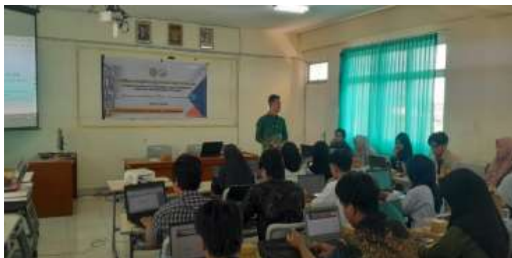
Gambar 2. Suasana penyampaian materi dan tanya jawab

Pada sesi praktik, mahasiswa diarahkan untuk menyusun draft artikel singkat sesuai kaidah penulisan ilmiah dan mensimulasikan proses editorial menggunakan studi kasus yang relevan. Dari hasil praktik, sebagian besar peserta mampu memahami tahapan dasar penerbitan jurnal, meskipun masih diperlukan pendampingan intensif terutama dalam aspek teknis penggunaan platform manajemen jurnal seperti Open Journal System (OJS). Pelaksanaan kegiatan ini juga menghasilkan komitmen bersama untuk membentuk komunitas mahasiswa pengelola jurnal di tingkat program studi sebagai upaya keberlanjutan program. Dengan demikian, diharapkan tercipta ekosistem publikasi ilmiah yang lebih partisipatif di lingkungan Universitas Muhammadiyah Mataram. Adapun dokumentasi kegiatan saat penyampaian materi dan praktik seperti terlihat pada Gambar 2.