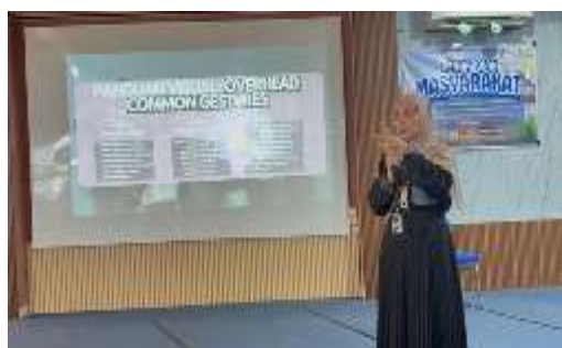
Gambar 3. Penyampaian Materi Pembuka terkait Urgensi Kemampuan Non Verbal oleh Ketua Tim PkM FISIP Universitas Sriwijaya

Pelatihan menggunakan pendekatan partisipasi, sehingga siswa diberikan ruang dan keleluasaan untuk bertanya, menyampaikan pendapat, memberikan ide, dan memaparkan solusi atas masalah. Sehingga pelatihan menggabungkan metode FGD dan role play . Sesi pelatihan diawali dengan penyampaian materi oleh Ketua Tim PkM yang meliputi urgensi dan pentingnya penguasaan komunikasi non verbal, jenis konflik, dinamika munculnya konflik baik pada individu maupun kelompok, serta mekanisme resolusi konflik yang baik. Sesi ini bertujuan untuk meningkatkan kesadaran dan pengetahuan atas dampak komunikasi non verbal pada kehidupan siswa. Selain itu, sesi ini juga bertujuan untuk membentuk keterampilan komunikasi yang lebih empati melalui active listening bagi para siswa (Fakhri et al., 2021).