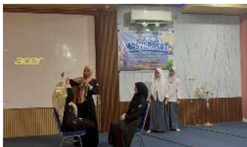
Gambar 4. Sesi Pertama Role Play Praktek Komunikasi Non Verbal

Melalui permainan ini, siswa dilatih untuk memiliki kepekaan dan empati akan suatu masalah. Selain itu, siswa juga dikenalkan dengan berbagai isu terkait hubungan internasional yang sedang terjadi secara sederhana. Sehingga pengetahuan umum para siswa juga semakin meningkat. Secara umum, sesi pertama bertujuan untuk mengetahui dan mengidentifikasi kemampuan siswa terkait komunikasi non verbal dan ketepatan penggunaan dari komunikasi non verbal pada kehidupan sehari-hari (Suyani et al., 2025). Harapannya, melalui sesi ini siswa tidak hanya menjadi pendengar yang baik. Lebih dari itu, siswa memiliki kepekaan sosial atas masalah yang terjadi di sekitarnya.