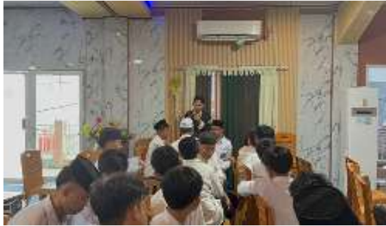
Gambar 5. Sesi Kedua Praktek Mendengarkan dengan Baik ( Active Listening )

sedang menjelaskan sesuatu. Namun bukan menyimak dengan seksama dan memberikan tanggapan yang baik.