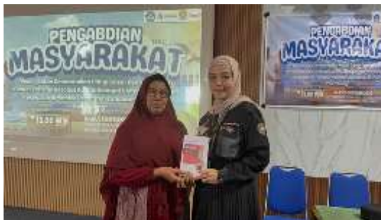
Gambar 2. Penyerahan Modul Pelatihan kepada Kepala Sekolah oleh Ketua Tim PkM FISIP Universitas Sriwijaya

disampaikan pada rangkaian sosialisasi dapat membentuk pribadi siswa agar lebih adaptif, responsif, dan solutif dalam mengelola konflik. Selain itu Kepala Sekolah juga menyampaikan bahwa pelatihan ini dapat membentuk public speaking dari siswa, sehingga harus dimanfaatkan dengan baik. Secara simbolis, Ketua PkM FISIP, juga menyampaikan modul kepada Kepala Sekolah.