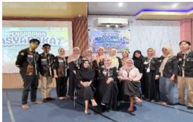
Gambar 6. Tim PkM (Dosen dan Mahasiswa) FISIP Universitas Sriwijaya