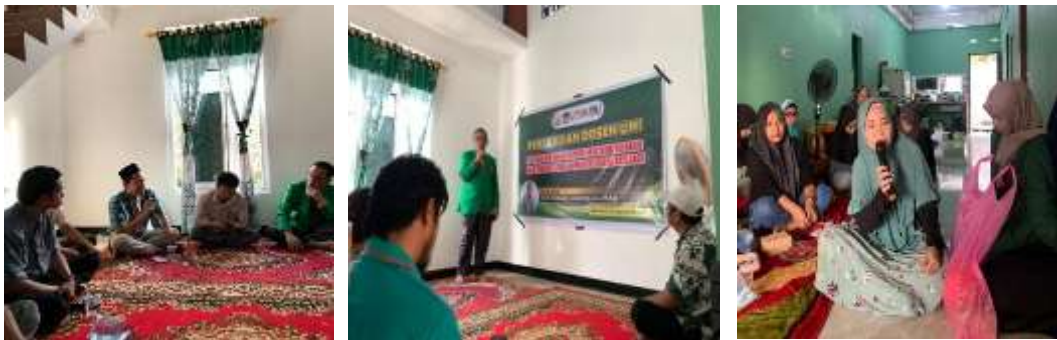
Gambar 1: Kegiatan workshop pengabdian dan diskusi bersama mitra

Dari sisi demografi, mustahik berusia antara 25-45 tahun, dengan komposisi 65% perempuan dan 35% laki-laki. Hal ini menunjukkan bahwa peran perempuan dalam mengelola usaha keluarga cukup besar dan dapat menjadi motor penggerak peningkatan ekonomi rumah tangga. Profil ini juga menegaskan pentingnya pendekatan yang tidak hanya berorientasi pada pemberian modal, tetapi juga pembinaan keterampilan dan pemberdayaan berbasis keluarga.