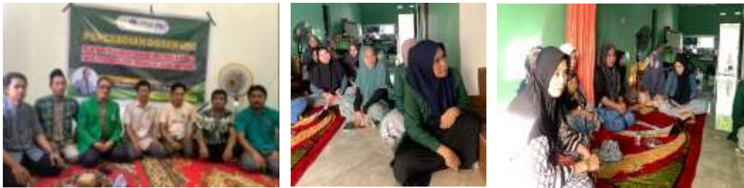
Gambar 2: Foto bersama mitra saat kegiatan workshop selesai

Selain kegiatan kelompok, dilakukan juga monitoring individu setiap bulan untuk memantau perkembangan usaha masing-masing mustahik. Monitoring ini mencakup pencatatan pendapatan, kendala yang dihadapi, serta strategi perbaikan. Dengan pendekatan ini, tim pendamping dapat memberikan solusi yang lebih spesifik, misalnya membantu strategi pemasaran online untuk mustahik yang menjual produk makanan, atau memperluas jejaring pemasok bagi pedagang kelontong.