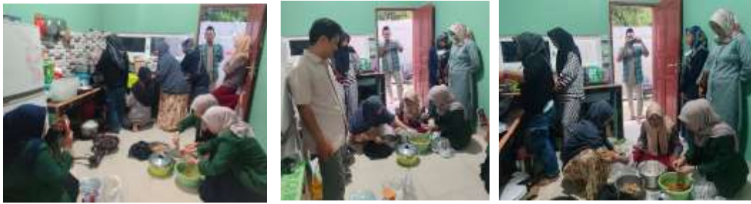
Gambar 3: Proses pendampingan pembuatan beberapa produk mitra

menuju kemandirian. Jika model ini direplikasi dengan skala yang lebih besar, maka potensi mustahik untuk bertransformasi menjadi muzakki di masa depan semakin terbuka. Dengan demikian, zakat produktif tidak hanya memberikan solusi sementara, tetapi juga membuka jalan menuju kesejahteraan berkelanjutan.