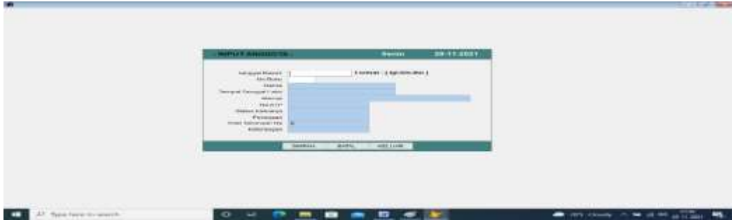
Gambar 2 Tampilan Pengolahan Data Anggota

Untuk Input anggota disini kita memasukan tanggal masuk, No. Buku, nama, tempat dan tgl lahir, alamat, no.telp, pekerjaan, jumlah yang ingin ditabung.