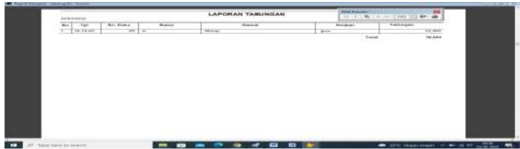
Gambar 5 Tampilan Laporan