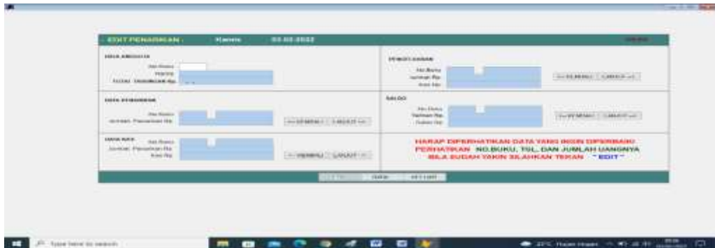
Gambar 6 Tampilan Penarikan

Dalam penarikan akan dibetikan informasi uang yang ada, bila lebih besar dari penarikan maka akan ada pesan “penarikan lebih besar dari simpanan” proses ditolak.