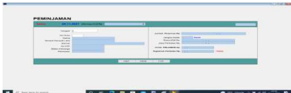
Gambar 7 Tampilan Peminjaman

Peminjaman akan berhasil bila tidak ada tugakan atau peminjaman sebelumnya, serta sudah menjadi anggota koperasi.