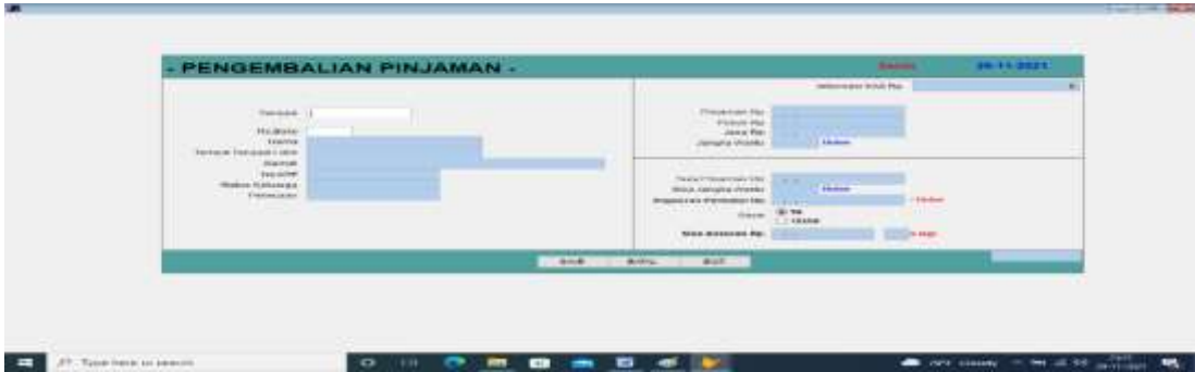
Gambar 8 Tampilan Pengembalian