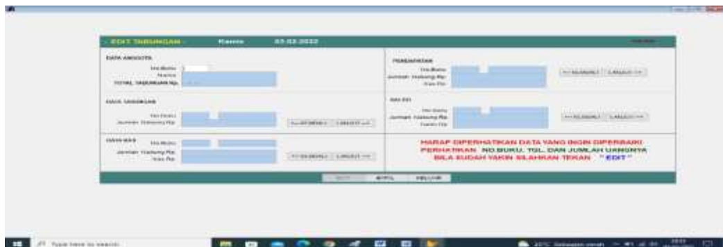
Gambar 4 Tampilan proses tabungan

Memasukan data mulai dari no.anggota sampai pada jumlah yang akan ditabung, dan dapat melihat laporan dari tabungan tersebut.