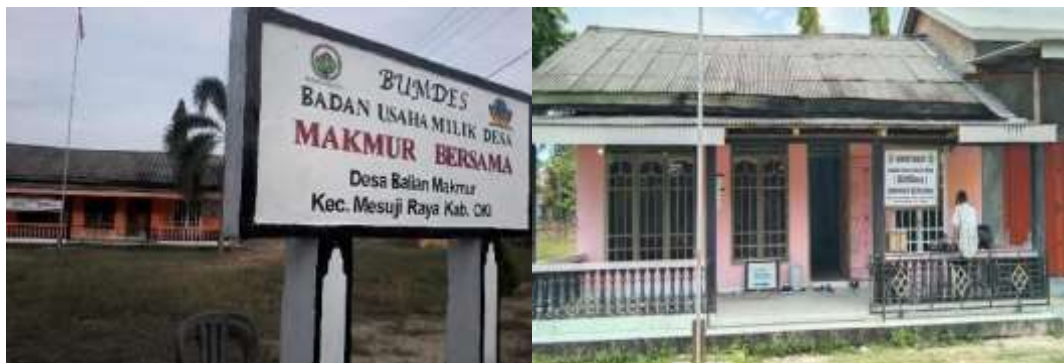
Gambar 10 Kantor Bumdes Makmur Besama