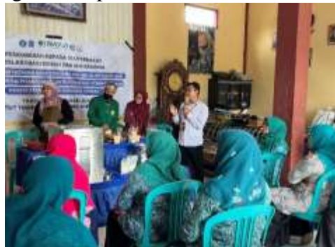
Gambar 2. Diskusi kewirausahaan syariah dan pendampingan manajemen usaha mikro.

Kegiatan ini juga memberikan dampak sosial yang signifikan. Anggota PKK yang sebelumnya belum memiliki aktivitas produktif kini bertransformasi menjadi pelaku usaha rumah tangga. Mereka menunjukkan peningkatan rasa percaya diri, semangat gotong royong, serta tanggung jawab dalam mengelola usaha kelompok. Nilai-nilai kewirausahaan syariah seperti jujur, amanah, dan keberkahan menjadi bagian dari perilaku usaha mereka.