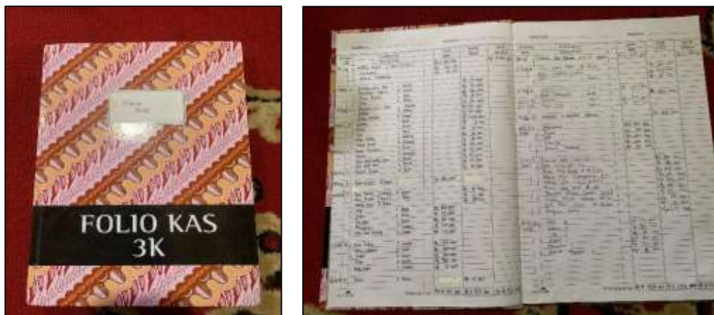
Gambar 3. Pencatatan Laporan Keuangan Sederhana

Keterlibatan mahasiswa sebagai fasilitator juga terbukti memperlancar proses pelatihan, karena memungkinkan pendampingan individual yang lebih intensif terhadap peserta yang mengalami kesulitan. Pola kolaborasi akademisi-masyarakat seperti ini mencerminkan esensi pendekatan partisipatif yang dikemukakan Usadolo & Caldwell (2016), di mana keberhasilan program ditentukan oleh kualitas keterlibatan semua pihak.