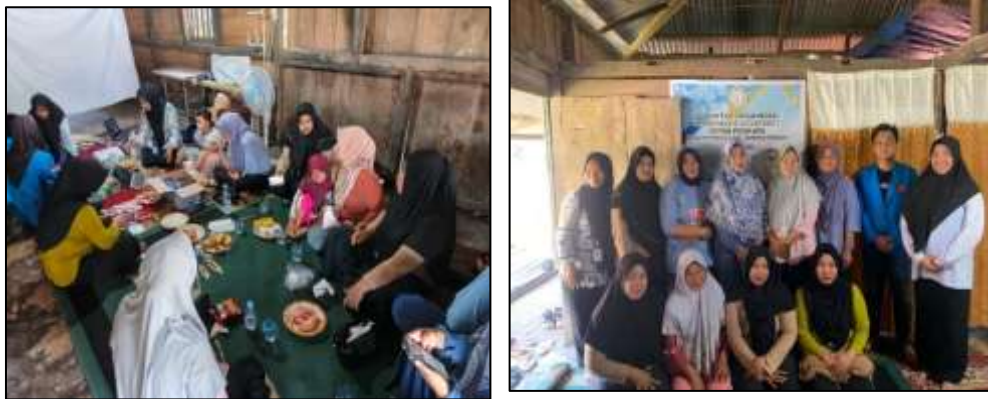
Gambar 1. Observasi awal dan Diskusi dengan pelaku UMKM Intan Permata

Temuan ini menegaskan urgensi intervensi pelatihan yang tidak hanya bersifat sosialisatif, tetapi juga menyediakan alat praktis yang dapat langsung digunakan. Nilai pre-test rata-rata peserta yang berada pada 42 poin (skala 100) mencerminkan tingkat pemahaman awal yang masih sangat rendah terhadap konsep-konsep dasar pembukuan usaha