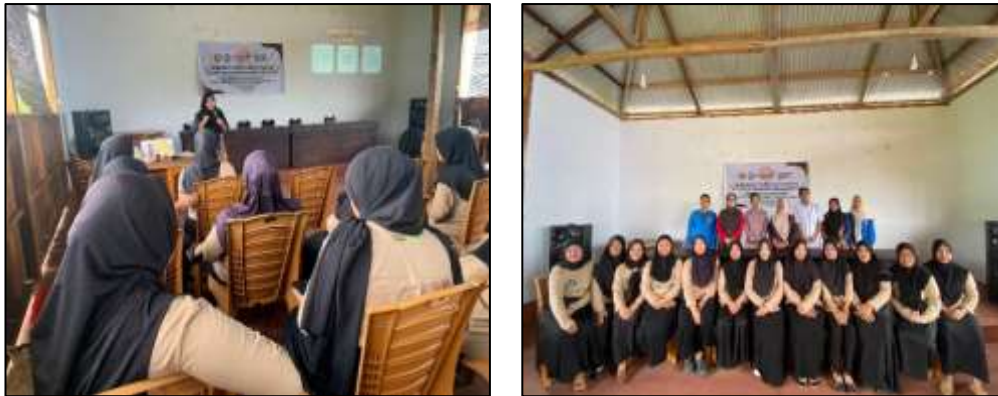
Gambar 2. Sosialisasi Literasi Keuangan