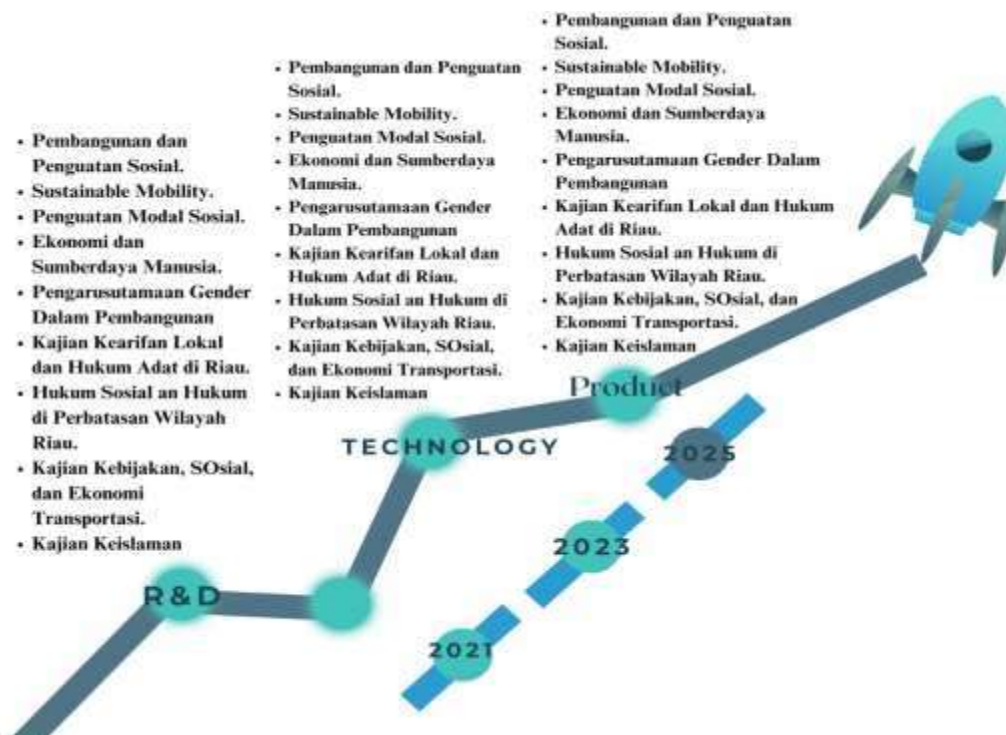
Gambar 3. Renstra PKM UIR 2021-2025

Kegiatan PKM ini dilakukan dalam upaya realisasi perencanaan bidang penelitian dan pengabdian masyarakat perguruan tinggi sehingga kegiatan PKM yang dilakukan relevan dengan Renstra DPPM UIR 2021-2025 yang berfokus pada SDGs terkait Tema Sosial Humaniora bidang Ekonomi dan Sumberdaya Manusia dapat dilihat pada gambar 3. berikut.