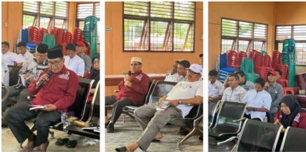
Gambar 7. Dialog antara Tim PKM dengan BPD Bandur Picak

Keberlanjutan Pembangunan Desa di Desa Bandur Picak, Koto Kampar Hulu” telah dilaksanakan pada Tanggal 10 September 2025. Berjalan melalui tahapan yang saling melengkapi. Tahap awal dimulai dengan survei, di mana tim turun langsung ke lapangan, mendengarkan cerita warga, mengamati kondisi kelembagaan BPD, serta mencatat kebutuhan nyata desa. Setelah itu, sosialisasi dilakukan sebagai ruang pertemuan yang hangat, memperkenalkan tujuan PKM, manfaat yang diharapkan. Kegiatan penyuluhan, di mana tim PKM yang terdiri dari dosen dan mahasiswa menyampaikan materi inti tentang desa sebagai fondasi pembangunan desa, arah pembangunan desa dalam kerangka Asta Cita, serta kedudukan BPD sebagai pengawal keberlanjutan pembangunan. Setelah penyampaian materi dilakukan maka dilanjutkan dengan sesi dialog tanya jawab, dapat dilihat pada gambar 7 Berikut.