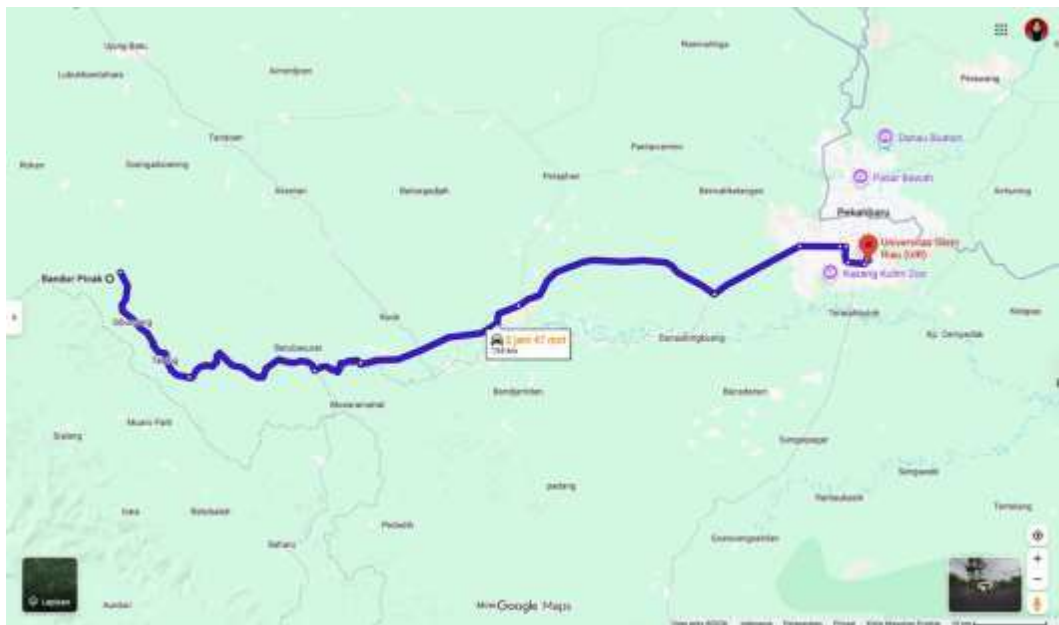
Gambar 10. Peta Lokasi Desa Bandur Picak