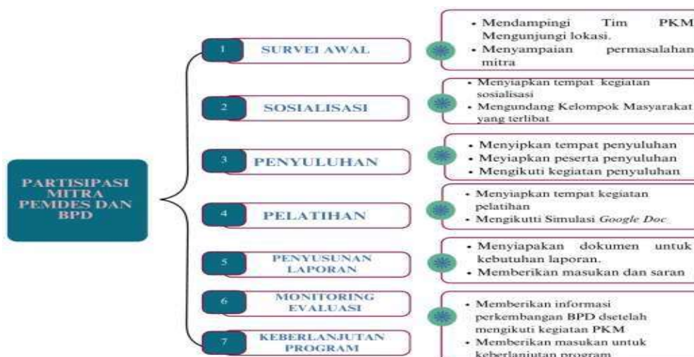
Gambar 6. Partisipasi Mitra Pemerintah Desa dan BPD Bandur Picak, Kampar

Kegiatan PKM yang dilaksanakan terdapat beberapa partisipasi mitra untuk mendukung keberhasilan kegiatan, divisualisasikan pada gambar 6 berikut.