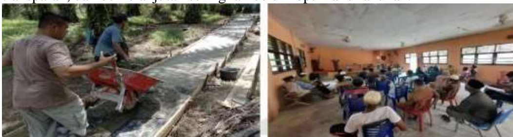
Gambar 1. Kegiatan Musyawarah dan Pembangunan Jalan Desa Bandur Picak, Koto Kampar Hulu

Desa Bandur Picak merupakan salah satu desa yang terletak di Kecamatan Koto Kampar Hulu, Kabupaten Kampar, Provinsi Riau. Desa ini memiliki potensi sumber daya alam dan masyarakat yang besar untuk mendukung pembangunan berkelanjutan, baik dari sisi pertanian, kehutanan, maupun kearifan lokal (Hennink & Kaiser, 2022; Wang et al., 2025). Namun, dalam praktiknya, keberlanjutan pembangunan desa masih menghadapi sejumlah tantangan, terutama yang berkaitan dengan fungsi kelembagaan desa seperti BPD. BPD sebagai representasi masyarakat desa memiliki peran strategis dalam merancang, mengawal, serta mengevaluasi arah pembangunan desa (Renukappa et al., 2022; Sabet & Khaksar, 2024). Namun, potensi BPD dalam mewujudkan tata kelola desa yang partisipatif, transparan, dan berkelanjutan seringkali belum optimal dilakukan.