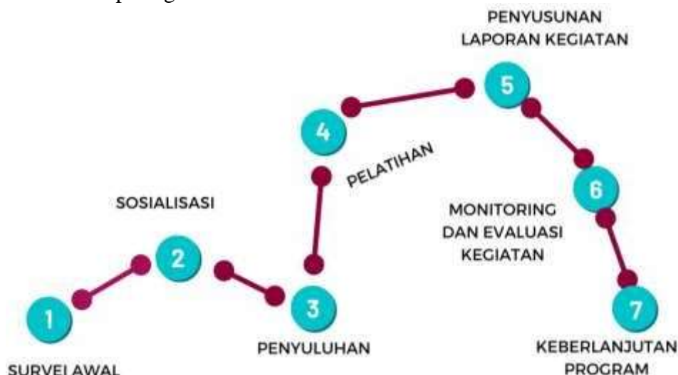
Gambar 5. Tahapan Pelaksanaan Kegiatan PKM

Tahapan pelaksanaan dalam kegiatan PKM ini terdiri dari beberapa tahapan, divisualisasikan pada gambar 5. berikut: