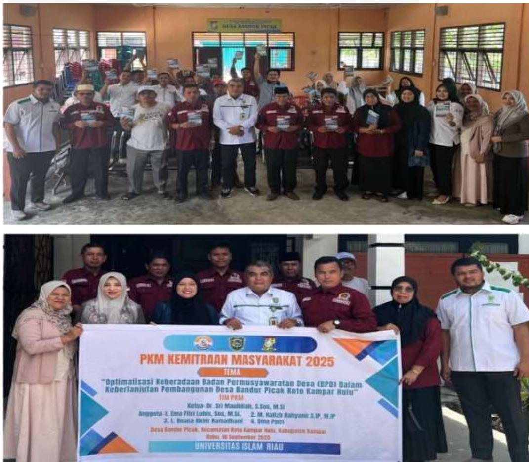
Gambar 8. Pelaksanaan Penyuluhan dan Pelatihan PKM Pada BPD di Desa Bandur Picak

Setelah kegiatan inti, dilanjutkan dengan monitoring dan evaluasi, untuk menilai sejauh mana kegiatan memberi dampak, sekaligus menemukan ruang perbaikan. Tahap terakhir adalah keberlanjutan program, yang dirancang agar hasil PKM tidak berhenti di satu waktu, melainkan berkelanjutan melalui pendampingan dan forum komunikasi rutin.