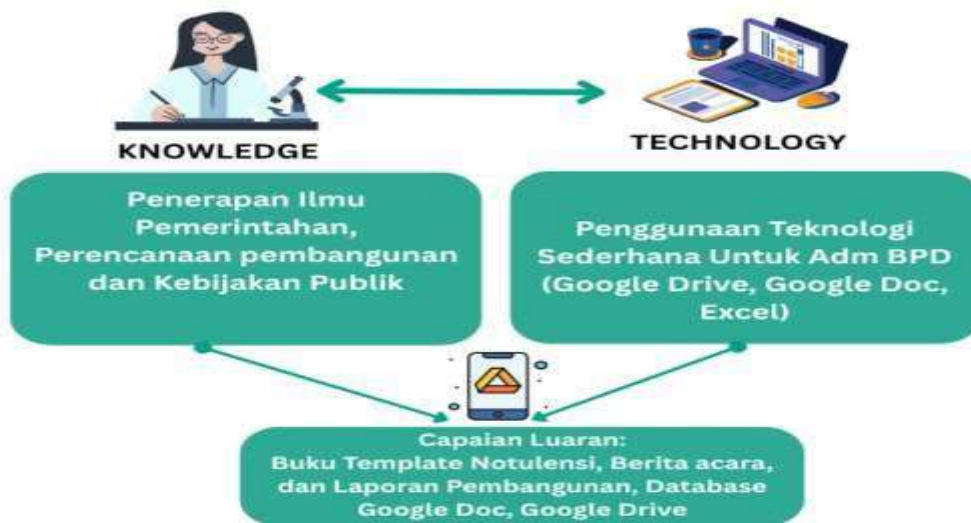
Gambar 9. Gambaran IPTEKS Optimalisasi BPD