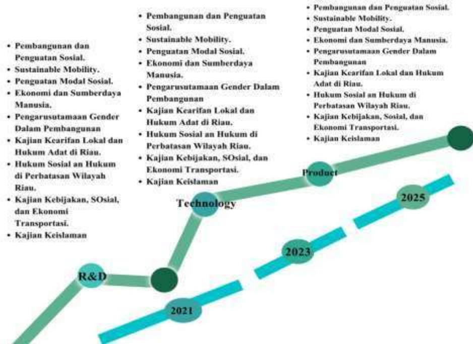
Gambar 2. Renstra PKM UIR 2021-2025

Kegiatan PKM ini dilakukan dalam upaya realisasi perencanaan bidang penelitian dan pengabdian masyarakat perguruan tinggi sehingga kegiatan PKM yang dilakukan relevan dengan Renstra DPPM UIR 2021-2025 yang berfokus pada SDGs terkait Tema Sosial Humaniora bidang Ekonomi dan Sumberdaya Manusia dapat dilihat pada gambar 2. berikut.