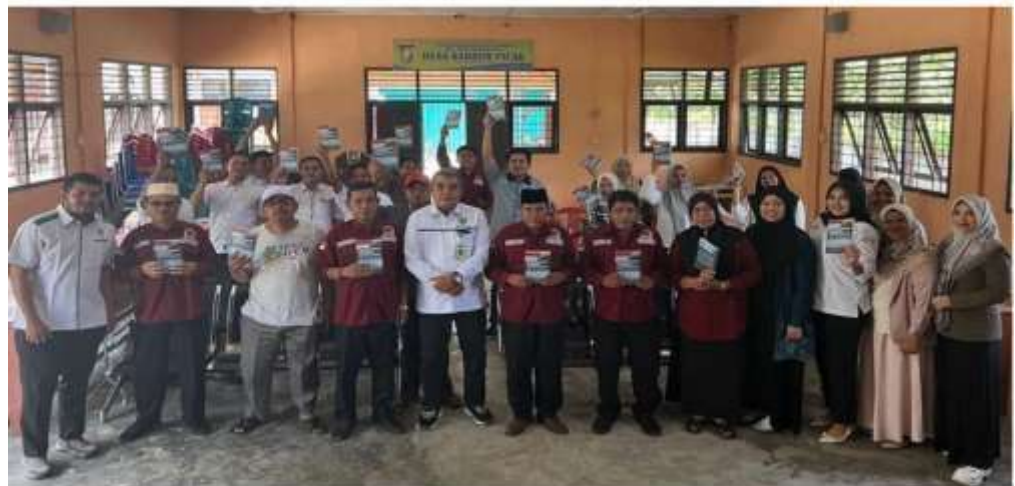
Gambar 7. Pelaksanaan Kegiatan PKM dan Penyerahan Bantuan Buku pada Lembaga Kemasyarakatan Desa.

Untuk memastikan efektivitas, dilakukan monitoring dan evaluasi terhadap manfaat kegiatan bagi mitra. Tahap terakhir adalah keberlanjutan program, yang menilai keberhasilan PKM dalam meningkatkan profesionalitas LKD serta merancang tindak lanjut agar hasil kegiatan tetap berkesinambungan bagi tata kelola desa.