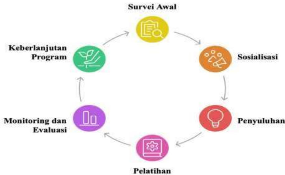
Gambar 4. Tahapan Pelaksanaan Kegiatan PKM