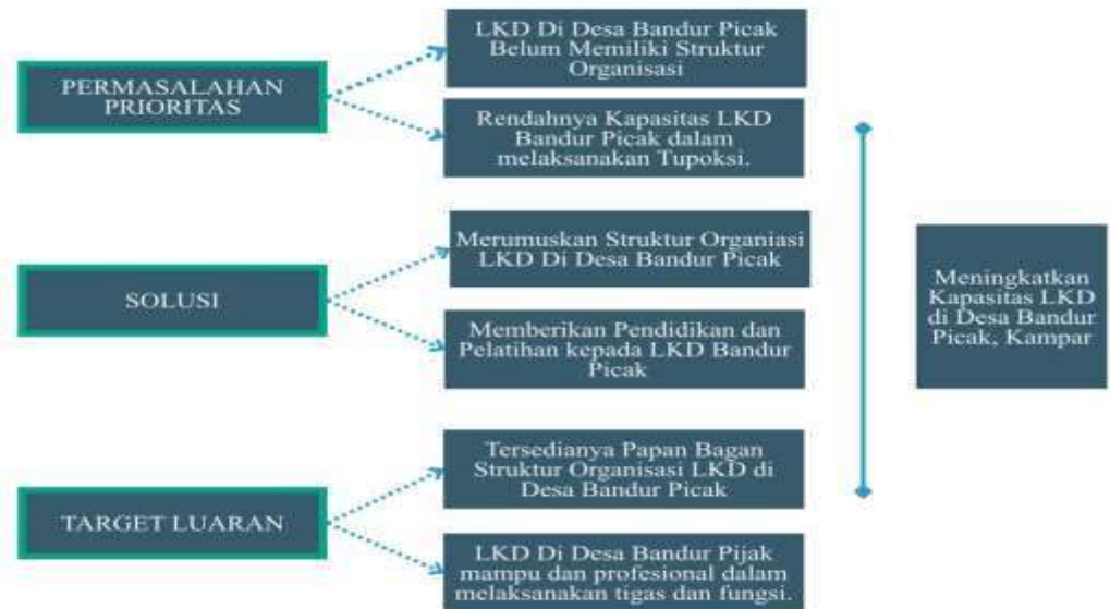
Gambar 1. Alir Antara Permasalahan, Solusi, dan Target PKM Dalam pelaksanaan kegiatan pengabdian masyarakat ini adapun tujuan yang ingin dicapai yaitu sebagai berikut: