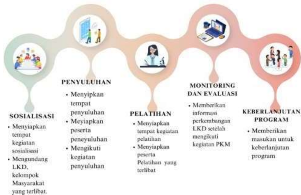
Gambar 5. Partisipasi Mitra Pemerintah Desa dan LKD Bandur Picak, Kampar