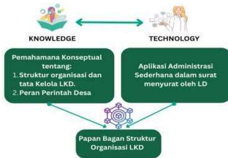
Gambar 8. Gambaran IPTEKS Penguatan Kapasitas LKD di Desa Bandur Picak, Kampar