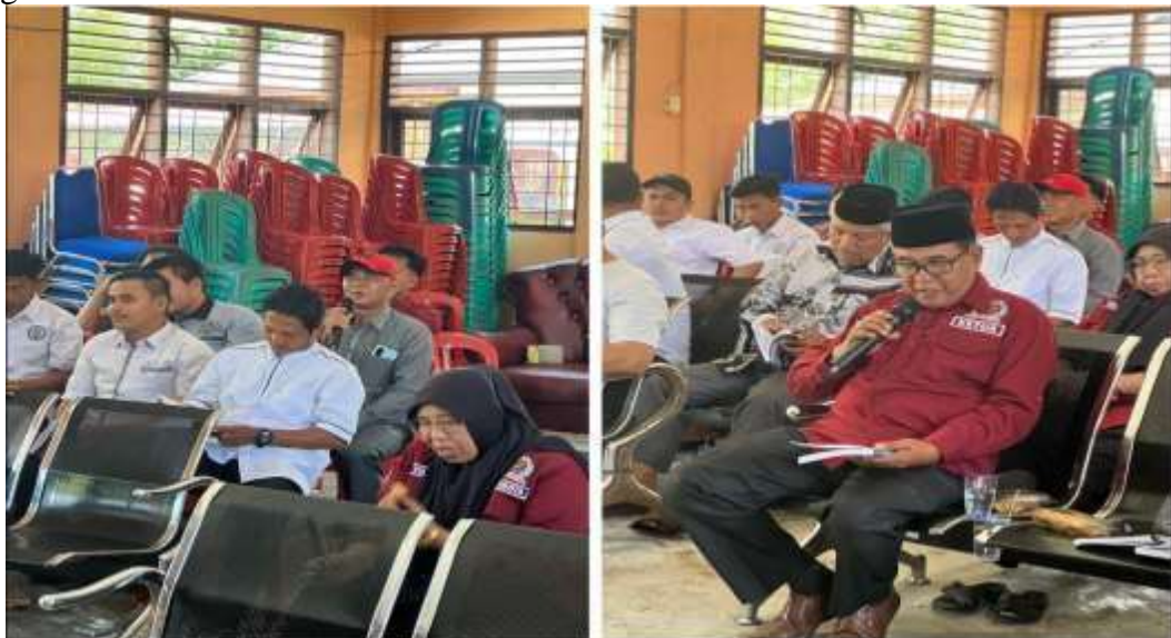
Gambar 6. Dialog antara Tim PKM dengan Pemdes dan LDK Bandur Picak Selanjutnya dilakukan kegiatan pelatihan, materi yang disampaikan

Pelaksanaan kegiatan PKM dilakukan Tanggal 10 September 2022 di Aula Kantor Desa Bandur Picak Kabupaten Kampar dilakukan melalui tahapan yang terstruktur. Tahap pertama adalah survei, di mana tim PKM melakukan kunjungan awal ke pemerintah desa untuk mengidentifikasi permasalahan LKD sehingga kegiatan dapat disesuaikan dengan kebutuhan. Setelah itu dilanjutkan dengan sosialisasi, berupa diskusi internal tim PKM dan penyampaian informasi kepada Pemdes mengenai bentuk kegiatan, tujuan, manfaat, serta solusi yang direkomendasikan. Tahap penyuluhan dilaksanakan oleh Tim PKM yang terdiri dari dosen dan mahasiswa dengan materi tentang keberadaan pemerintah desa dalam sistem NKRI, kebijakan pemerintahan desa, serta kedudukan Lembaga Kemasyarakatan Desa sebagai mitra pemerintahan desa. Setelah pemaparan materi penyuluhan, selanjutnya dilakukan dialog tanya jawab dengan peserta, dapat dilihat gambar 6.