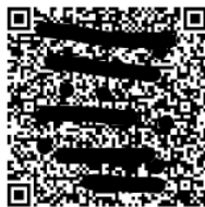
Gambar 16 Lampiran Kirim Dokumen

Pada bagian ini digunakan untuk mengirim laporan SPT PPh Tahunan badan dengan cara memasukan kode verifikasi yang telah dikirimkan oleh DJP ke email disaat pertama kali kita mengunduh formulir e-form PDF SPT PPh Tahunan Badan.