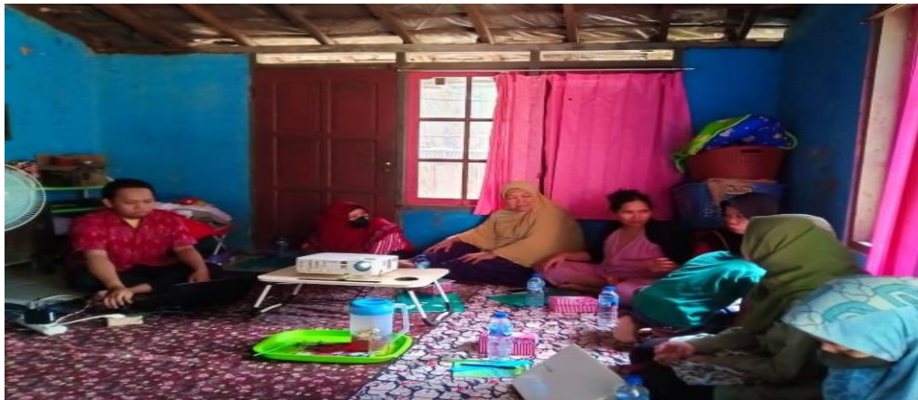
Gambar 2. Pelatihan pembukuan keuangan usaha mitra

Setelah dilakukan pendampingan penyusuna pembukuan keuangan mitra, selanjutnya tim pengabdian melakukan monitoring atas progress usaha yang dijalankan mitra selama satu bulan berikutnya dengan mendatangi mitra. Hal ini dilaksanakan guna mengetahui besaran laba rugi serta kendala apa saja yang dihadapi oleh mitra, serta mengarahkan langkah apa saja yang harus diambil untuk terus mengembangkan usaha mitra.