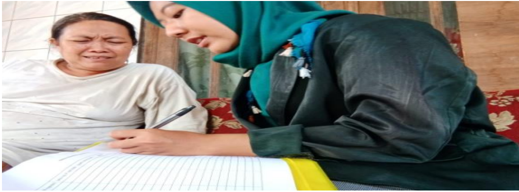
Gambar 3. Monitoring pembukuan pada progress usaha mitra