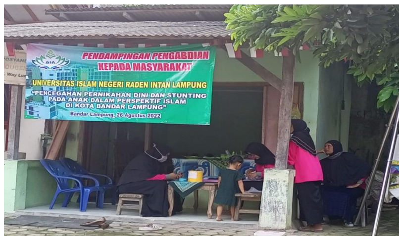
Gambar 2. Lokasi Pengabdian di Kelurahan Waylunik Kecamatan Panjang, Kota Bandar Lampung

Dari hasil riset ada sebagian aspek pemicu terbentuknya stunting dalam bayi umur 0-59 bulan ialah status vitamin, berat badan, lahir, kecil, tingakt pendidikan ibu, tingkat pendapatan keluarga, serta keragaman pangan. Terdapat ikatan antar faktor- faktor pemicu peristiwa itu. (Nasution & Susilawati, 2022). Dari hasil riset ada sebagian aspek pemicu terbentuknya stunting dalam bayi umur 0-59 bulan ialah status vitamin, berat badan lahir kecil, tingakt pendidikan orang tua, tingkat pendapatan keluarga, serta keragaman pangan. Ada ikatan dampingi faktor-faktor pemicu peristiwa itu. (Nasution & Susilawati, 2022)