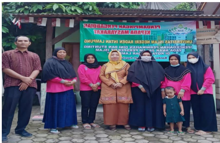
Gambar 5. Photo bersama Tim Pengabdian Kepada Masyarakat UIN Raden Intan Lampung dengan tenaga Kesehatan

Islam memandang makan dengan makanan yang halal dan thayyibah bagian dari pencegahan stunting bagi anak. Menyusui selama 6 bulan bagian dari menghindari berbagai penyakit.