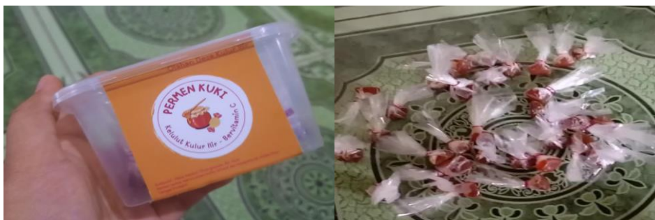
Gambar 6 Kemasan Permen Kuki