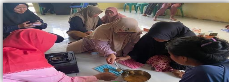
Gambar 5 Pelatihan Permen Kuki

Sosialisasi pembuatan permen kuki kepada masyarakat kulur ilir untuk mengembangkan potensi dan peran ibu-ibu rumah tangga yang ada di desa dan memberikan inovasi mengenai produk air madu kelulut. Selain kegiatan sosialisasi juga diadakan pelatihan dalam membuat permen kuki ini. Sosialisasi dan pelatihan ini tidak terlepas dari peran mahasiswa, perangkat desa dan masyarakat dalam mempersiapkan materi dan alat pendukung lainnya yang diberikan. Pelatihan yang diberikan mulai dari proses pembuatan permen kuki, pengemasan permen dan pemasarannya. Selama pelatihan masyarakat diberikan kesempatan dalam melakukan salah satu langkah dalam pembuatan dan mencicipi permen kuki ini seperti pada gambar 5.