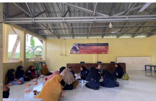
Gambar 4 Pelatihan Pengolahan Permen Kuki

Sosialisasi pembuatan permen kuki kepada masyarakat kulur ilir untuk mengembangkan potensi dan peran ibu-ibu rumah tangga yang ada di desa dan memberikan inovasi mengenai produk air madu kelulut. Selain kegiatan sosialisasi juga diadakan pelatihan dalam membuat permen kuki ini. Sosialisasi dan pelatihan ini tidak terlepas dari peran mahasiswa, perangkat desa dan masyarakat dalam mempersiapkan materi dan alat pendukung lainnya yang diberikan. Pelatihan yang diberikan mulai dari proses pembuatan permen kuki, pengemasan permen dan pemasarannya. Selama pelatihan masyarakat diberikan kesempatan dalam melakukan salah satu langkah dalam pembuatan dan mencicipi permen kuki ini seperti pada gambar 5.