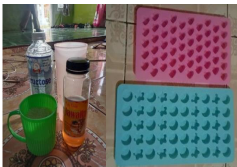
Gambar 3 Alat dan bahan