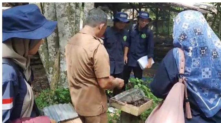
Gambar 2 Observasi tempat budidaya madu kelulut

Pengembangan produk tersebut diperlukan untuk meningkatkan nilai tambah produk, dan adanya pemberdayaan masyarakat, serta membuka peluang usaha untuk seluruh kalangan masyarakat Desa (Suherman et al., 2021). Proses mengembangkan produk ini dimulai dengan melakukan observasi ke tempat budidaya madu kelulut, yang mana kepala desa dan beberapa warga yang membudidayakannya. Kemudian dalam proses pembuatan permen kuki ini memerlukan alat dan bahan seperti, air madu kelulut, sirup glukosa, gula dan cetakan silicon untuk mencetak adonan permen hingga mengeras.