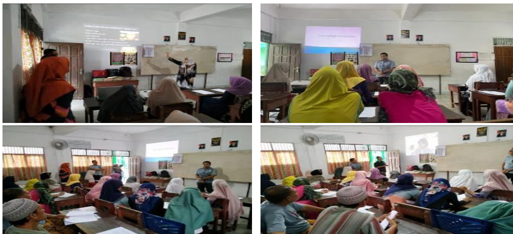
Gambar 3: Penyampaian Materi Penyuluhan oleh Tim Dosen Pengabdian Kepada Masyarakat

Setelah selesai menayangkan video kemudian dilanjutkan dengan sesi tanya jawab. Tim penyuluh memberikan kesempatan kepada warga masyarakat untuk mengajukan pertanyaan kepada pemateri. Dari beberapa pertanyaan yang diajukan oleh masyarakat pada dasarnya adalah sama, yaitu berbasis seputar kesehatan serta perilaku hidup bersih dan sehat.