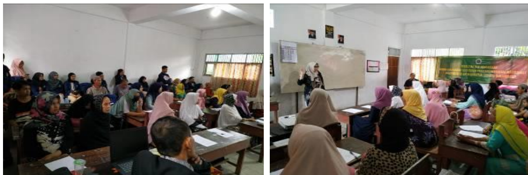
Gambar 2: Anggota masyarakat yang antusias mengikuti kegiatan penyuluhan

Kegiatan penyuluhan diberikan kepada warga masyarakat yang berada di Desa Tunggul Irang Martapura Kabupaten Banjar mengenai penerapan perilaku hidup bersih dan sehat (PHBS). (Dinas Kesehatan Kabupaten Banjar, 2017)