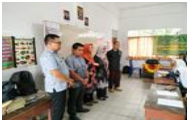
Gambar 1: Tim Dosen Pengabdian Masyarakat Memberikan Penyuluhan Kepada Masyarakat Tunggul Irang Martapura Kabupaten Banjar.

sebagai Ketua Tim Penyuluhan, dan dilanjutkan oleh sambutan dari bapak Ketua RT Setempat.