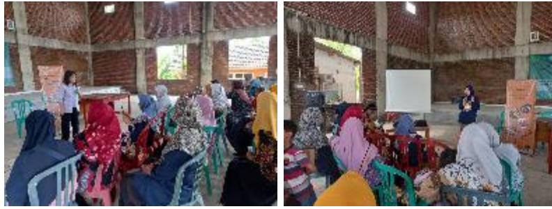
Gambar 3. Presentasi Pemanfaatan Potensi Lokal Dalam Mengembangkan Usaha Bisnis Pariwisata

Kedua , yaitu metode demonstrasi tentang pengolahan minuman sehat dari tanaman obat keluarga. Pembuatan minuman dilakukan oleh dosen bersama dengan salah satu wirausahawan yang merupakan owner dari salah satu restoran di Semarang, yang memiliki pengalaman dibidang meracik tanaman herbal sebagai minuman kesehatan. Masyarakat menunjukkan antusias yang besar dalam proses pelatihan. Masyarakat sebelumnya telah diinformasikan untuk menyiapkan berbagai bahan yang akan digunakan, terutama bahan dasar yang merupakan tanaman herbal dari milik masyarakat sendiri. Selanjutnya berbagai peralatan yang dibutuhkan dan beberapa bahan dan alat lain yang juga disiapkan oleh tim.