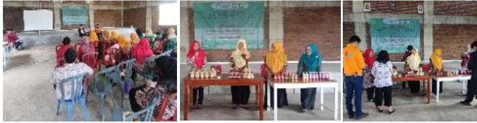
Gambar 5. Pelaksanaan FGD

Kegiatan FGD bersama masyarakat seperti pada gambar 5, serta produk hasil olahan kelompok masyarakat pada gambar 6, sebagai berikut: