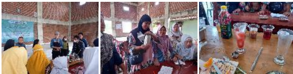
Gambar 4. Metode Demonstrasi Pembuatan Minuman Sehat dari Tanaman Obat

Pada pelatihan ini masyarakat yang telah dibagi dalam empat kelompok dilatih untuk meracik minuman dengan tiga resep yang berbeda, namun dengan bahan dasar yang sama. Yang membedakan yaitu penggunaan bahan tambahan seperti buah-buahan, atau jus untuk menambah cita rasa pada masing-masing resep. Demonstrasi dan pelatihan pembuatan minuman pada kelompok masyarakat seperti pada gambar 4 berikut: