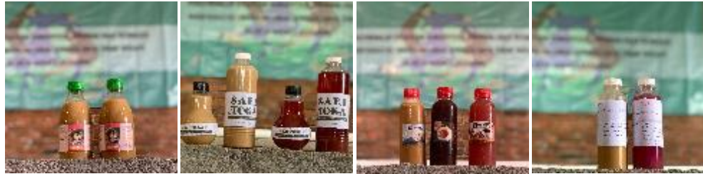
Gambar 6. Produk minuman sehat dari tanaman obat keluarga (kelompok 1, 2, 3, dan 4)

Kegiatan FGD berjalan dengan lancar, masyarakat dapat menghasilkan produk minuman sehat dengan memanfaatkan tanaman obat keluarga milik warga. Proses pendampingan dan pelatihan yang dilakukan sejauh ini diharapkan menjadi peluang dalam mendorong semangat masyarakat untuk mengembangkan dan memanfaatkan potensi lokal yang ada sebagai peluang pembangunan usaha bisnis masyarakat, khususnya pemanfaatan tanaman obat keluarga atau tanaman herbal di desa Branjang. Selanjutnya produk tersebut dapat dijadikan promosi minuman ketika adanya kunjungan wisatawan ke Desa Branjang.