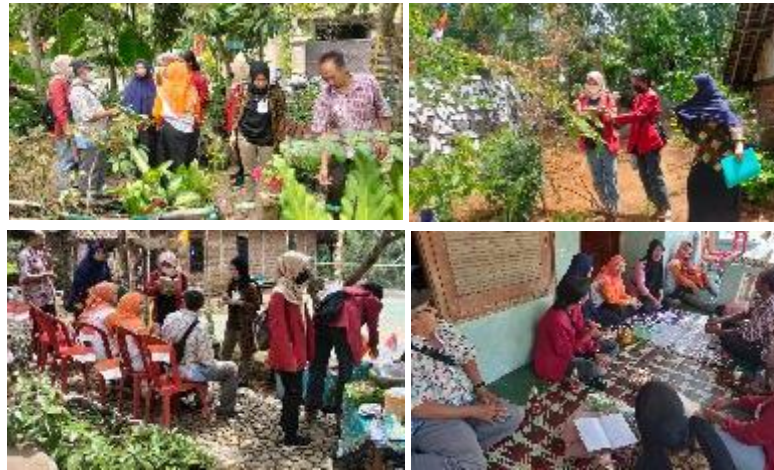
Gambar 2. Proses Identifikasi Potensi Tanaman Obat Keluarga