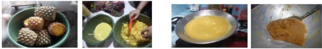
Gambar 3. Kunjungan melihat proses pembuatan selai nanas sebagai Produksi lokal Desa