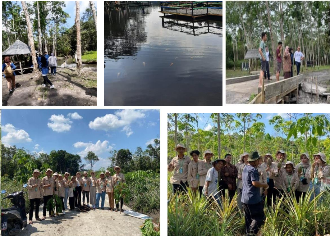
Gambar 4. Kunjungan melihat lokasi yang akan dijadikan Desa Wisata