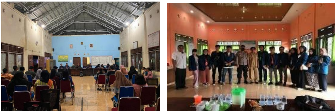
Gambar 1. Kegiatan sosialisasi penyusunan konsep desa wisata untuk menambah pendapatan

Setelah pemaparan selesai dilakukan oleh tim pengabdian maka sesi tanya jawab dilakukan, masyarakat sangat antusias dalam mempelajari pembuatan desa wisata, dimana pertanyaan yang diajukan cukup banyak diantaranya cara bagaimana administarasi untuk penjualan yang akan dilakukan oleh masyarakat setempat, bagaimana juga sistem bagi hasilnya nanti antara pendapatan masyarakat dan pendapatan untuk keuangan desa, dan bagaimana konsep dari pembuatan desa wisata yang bisa juga dibuat di setiap desa. Pertanyaan-pertanyaan tersebut membuat diskusi dan capaian tujuan dari pengabdian ini berhasil dilakukan.