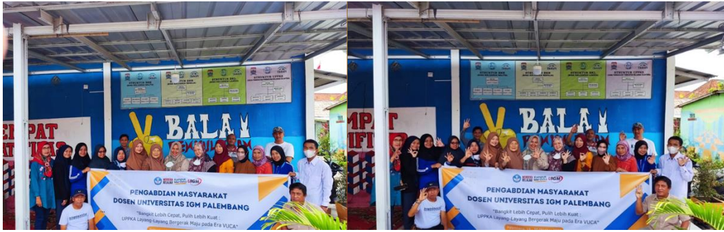
Gambar 4. Foto bersama diakhir kegiatan

Kegiatan diakhiri dengan memberikan sesi tanya jawab dan dilanjutkan dengan pengisian kuesioner post-test. Hasil pre-test dan post-test dapat disimpulkan bahwa beberapa peserta sudah mengenal literasi keuangan, menempatkan keuangannya dengan benar, dan sudah mulai menggunakan teknologi keuangan, namun masih dalam batas mengetahui saja. Seluruh peserta dalam pelatihan ini masih membutuhkan pengetahuan tentang literasi keuangan. Dalam hal ini individu harus berusaha kreatif dan berinovasi dalam pengambilan keputusan keuangannya, tentu saja harus didasari dengan pengetahuan keuangan. Karena era VUCA ini menuntut harus bisa bergerak secara cepat dan adaptif dalam menghadapi perubahan yang tidak tentu dan tidak bisa diperkirakan (Asri & Rahmat, 2022). Para individu maupun pembisnis harus paham mengenai VUCA untuk menghindari kerugian yang ditimbulkan (Widodo & Safi'i, 2022). VUCA merupakan tidak selalu suatu hal yang negative, bisa dimaksudkan sebagai wujud dari dunia yang terus mengalami perkembangan terus berubah dan tidak stagnan (Soraya et al., 2022).