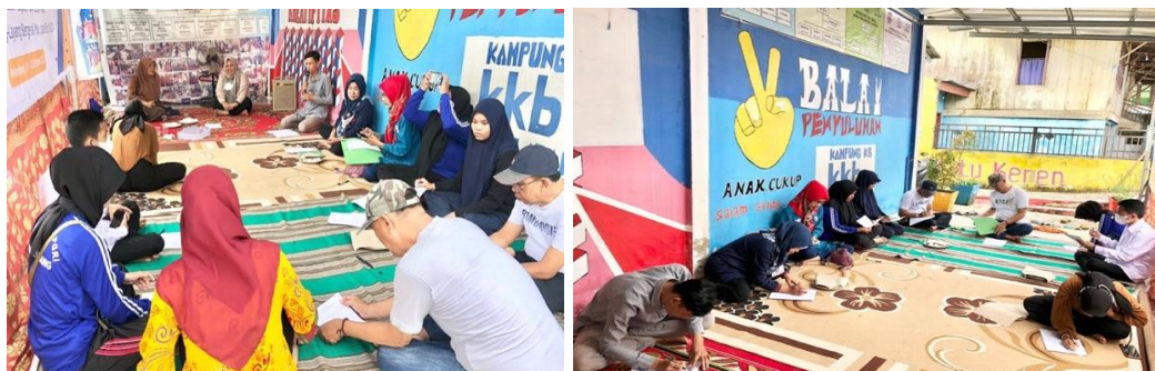
Gambar 3. Pengisian kuesioner pre-test dan post-test

Kegiatan pelatihan ini menjelaskan bagaimana cara menyisihkan uang dengan benar dan bijak disamping adanya cicilan (pengalokasian/ pengelolaan keuangan individu); serta cara menyimpan kekayaannya yang benar dengan tetap mengharapkan keuntungan/ tidak merugi (berinvestasi); serta ingin mendapatkan informasi lebih jelas mengenai finansial teknologi yang sekarang sedang menjadi trend dalam bentuk uang elektronik yang sekarang sering digunakan sebagai metode pembayaran; transfer uang; pinjaman; maupun pengelolaan asset (Fintech).