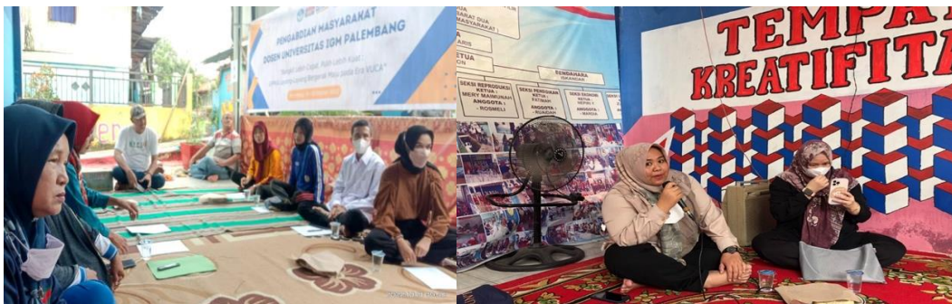
Gambar 2. Pemberian Materi terkait Literasi Keuangan

Pelaksanaan pengabdian kepada masyarakat ini berjudul pelatihan peningkatan literasi keuangan pada UPPKA layang-layang dalam menghadapi Era VUCA dilakukan selama 1 (satu) hari di balai UPPKA layang-layang, dihadiri oleh 32 peserta. Kegiatan ini diawali dengan penyebaran kuesioner pretest yang meliputi pengetahuan tentang literasi keuangan. Kegiatan selanjutnya dengan memberikan pemaparan materi kepada masyarakat yang menjadi peserta dalam kegiatan pengabdian ini dengan bahasa dan metode yang mudah dipahami agar materi yang disampaikan mudah diterima. Informasi yang didapatkan dalam kegiatan pengabdian ini mayoritas masyarakat memiliki tujuan yang sama yaitu agar kondisi ekonominya stabil dan sejahtera di masa sekarang maupun masa mendatang.