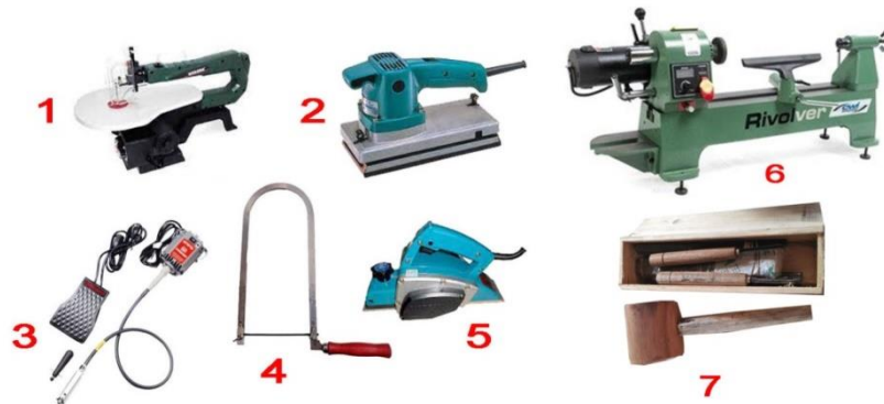
Gambar 4 Jenis peralatan yang digunakan

Setelah kegiatan sosialisasi tentang desain produk, dilanjutkan dengan kegiatan sosialisasi tentang pengetahuan alat dan bahan. Dengan adanya pengetahuan para peserta tentang alat dan bahan yang digunakan bisa mempermudah tim pengabdian melakukan praktik secara langsung terkait fungsi dan kegunaannya. Patriansah menjelaskan bahwa Pengenalan alat dan bahan merupakan tahapan yang sangat penting dari suatu kegiatan pelatihan. Melalui tahapan ini diharapkan peserta pelatihan dapat menguasai dan mengetahui fungsi dari alat dan bahan yang digunakan (Patriansah, 2021, p. 191). Berikut peralatan yang digunakan dalam pelatihan ini