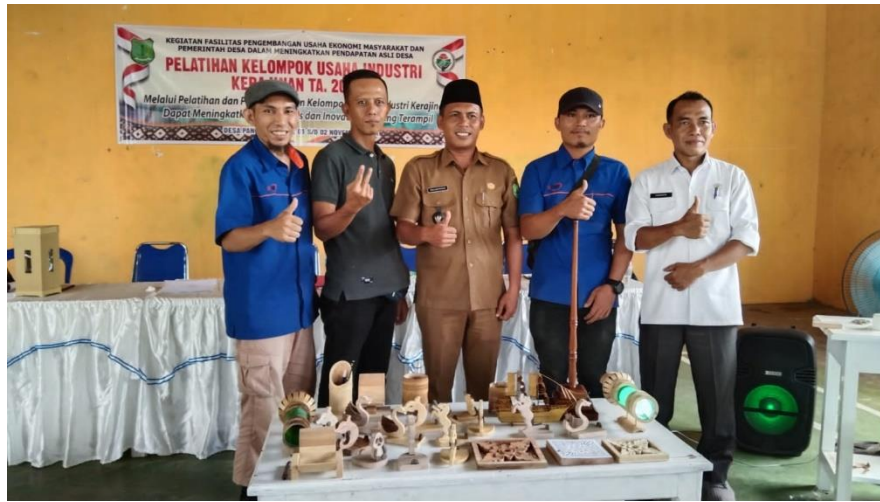
Gambar 14 Hasil Produk Kerajinan