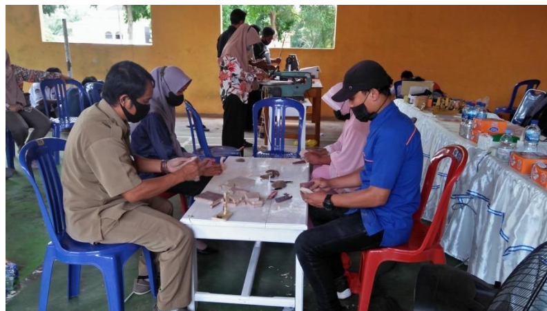
Gambar 11 Proses penghalusan produk kerajinan yang siap di finishing