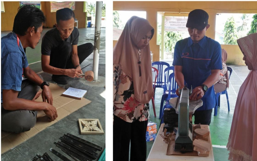
Gambar 8 Demonstrasi teknik ukir dan teknik Scroll

Kegiatan selanjutnya adalah kegiatan demonstrasi dengan cara mempraktikkan secara langsung teknik pembuatan kerajinan limbah kayu kepada peserta pelatihan. Dalam prosesnya para peserta dibimbing secara langsung dengan tujuan untuk mengasah kemampuan para peserta dalam menciptakan dan mengembangkan produk kerajinan yang memiliki nilai fungsi dan nilai estetik, sehingga produk kerajinan tersebut benar-benar mampu bersaing dan memenuhi kebutuhan pasar. Ketika pasar sudah didapatkan, tentu akan berdampak kepada peningkatan perekonomian warga melalui sektor industri kerajinan. Berikut kegiatan demonstrasi yang dilakukan :