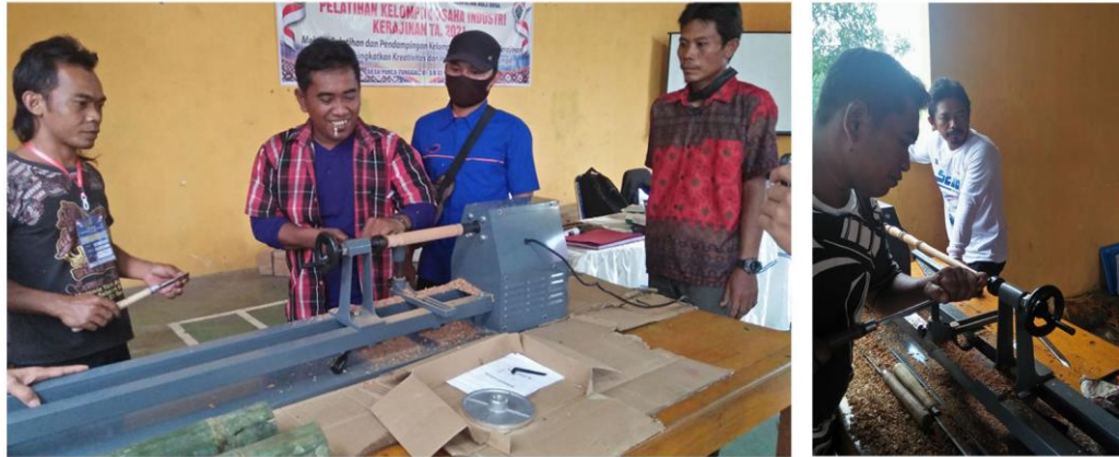
Gambar 9 Demonstrasi teknik bubut kayu