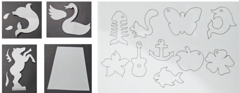
Gambar 2 Desain Stand Handphone & Gantungan Kunci

Kegiatan pelatihan kerajinan limbah kayu ini dimulai dengan memberikan sosialisasi tentang desain produk. Pada dasarnya desain memiliki fungsi mempermudah proses pekerjaan suatu produk yang dihasilkan. Di samping itu, desain memiliki peran vital dalam menciptakan dan mengembangkan suatu produk yang dibuat. Dengan adanya sebuah desain kita bisa mempertimbangkan secara langsung nilai fungsi dan nilai estetis dari sebuah produk kerajinan dengan melihat unsur-unsur rupa di dalamnya seperti unity (kesatuan), bentuk, ukuran, motif, dan lainnya. Dalam proses pembuatan desain produk kerajinan kita juga bisa dengan langsung melakukan riset dan studi kasus terhadap produk-produk sebelumnya yang sudah beredar di pasaran dengan tujuan agar bisa melakukan kreasi dan inovasi terhadap produk yang dihasilkan. Untuk mempermudah pemahaman para peserta terkait peran desain dalam suatu proses penciptaan sebuah produk, tim pengabdian sudah mempersiapkan beberapa desain seperti, gantungan kunci, asbak, pot bunga hias, lobster, dan stand handphone (HP).