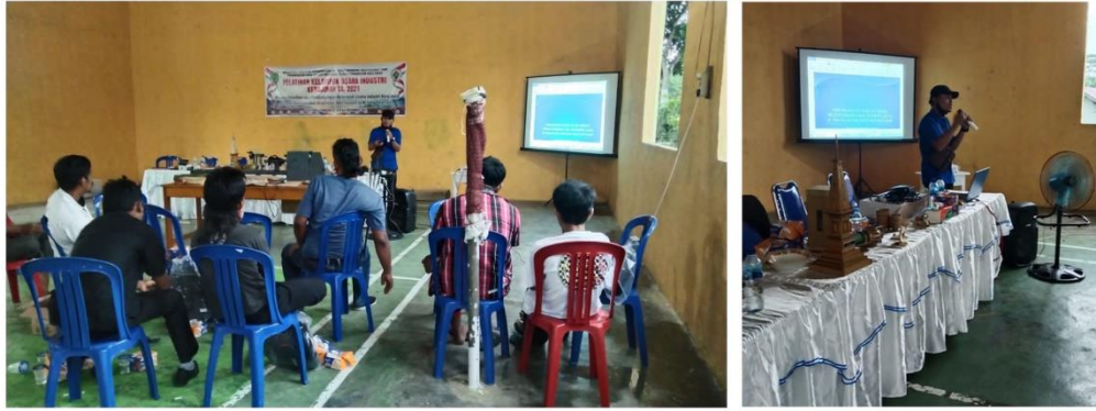
Gambar 7 Sosialisasi Materi Pelatihan Di Desa Panca Tunggal

Kegiatan selanjutnya adalah kegiatan demonstrasi dengan cara mempraktikkan secara langsung teknik pembuatan kerajinan limbah kayu kepada peserta pelatihan. Dalam prosesnya para peserta dibimbing secara langsung dengan tujuan untuk mengasah kemampuan para peserta dalam menciptakan dan mengembangkan produk kerajinan yang memiliki nilai fungsi dan nilai estetik, sehingga produk kerajinan tersebut benar-benar mampu bersaing dan memenuhi kebutuhan pasar. Ketika pasar sudah didapatkan, tentu akan berdampak kepada peningkatan perekonomian warga melalui sektor industri kerajinan. Berikut kegiatan demonstrasi yang dilakukan :