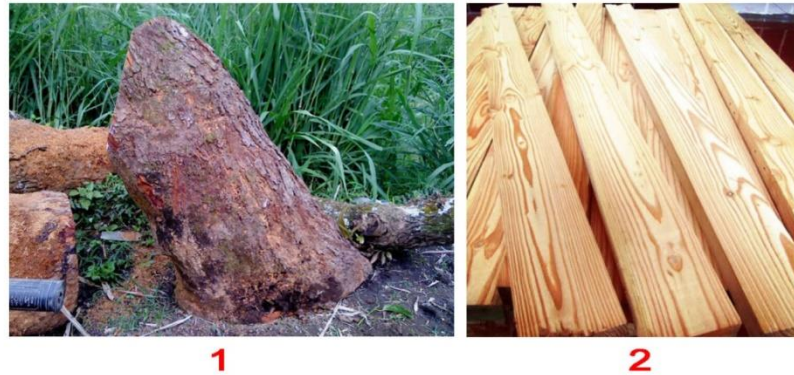
Gambar 6 Bahan Kayu

Peralatan pada gambar 4 di atas merupakan peralatan pendukung yang digunakan dalam kegiatan ini. Jenis peralatan pendukung tersebut di antaranya adalah (1) Lem G, (2) Amplas Kayu, (3) Impra, dan (4) Gergaji. Lem G digunakan untuk proses penyambungan kayu, amplas kayu digunakan untuk menghaluskan permukaan kayu, proses pengamplasan ini dilakukan sebelum memasuki tahapan finishing . Impra digunakan sebagai alat dan bahan untuk proses finishing , sedangkan gergaji digunakan untuk proses pemotongan bahan kayu.