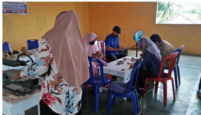
Gambar 10 Proses penghalusan produk kerajinan yang siap di finishing