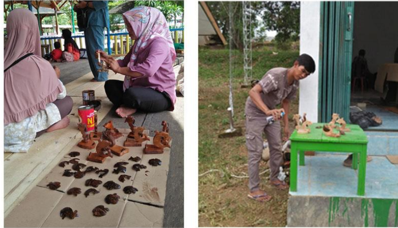
Gambar 12 Proses finishing