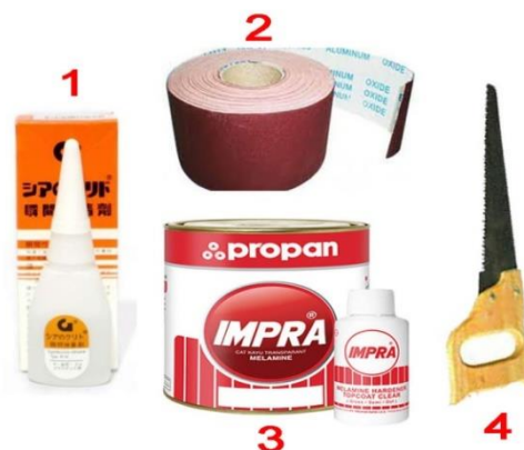
Gambar 5 Jenis Peralatan lainnya

Jenis peralatan pada gambar 2 merupakan peralatan utama yang digunakan dalam kegiatan pelatihan ini. (1) mesin scrollsaw , (2) mesin amplas, (3) mesin bor tuner , (4) gergaji triplek, (5) mesin ketam tangan, (6) mesin bubut kayu, (7) satu set alat ukir kayu. Setiap jenis peralatan yang ada pada gambar 4 di atas disosialisasikan kepada peserta pelatihan secara langsung, detail dan menyeluruh. Kehati-hatian dalam penggunaannya menjadi prioritas utama untuk menjaga keselamatan dalam berkerja.