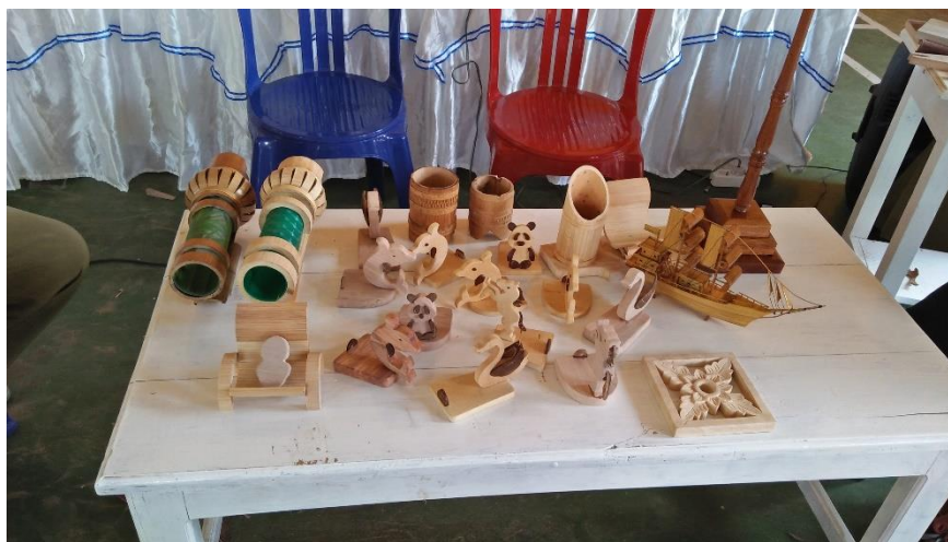
Gambar 13 Hasil Produk Kerajinan

Kegiatan evaluasi bertujuan untuk memberikan kritikan dan saran terkait kelebihan dan kekurangan dari hasil produk kerajinan yang dibuat. Hasil produk kerajinan yang dibuat oleh peserta pelatihan secara keseluruhan sudah memenuhi nilai fungsi dan nilai estetis, namun demikian sangat diperlukan bimbingan dan pelatihan secara berkala dan berkelanjutan terkait dengan pengembangan desain produk dan strategi digital marketing . Dengan adanya pelatihan secara berkala tersebut pemberdayaan warga desa Panca Tunggal dari sektor industri kerajinan memang benar-benar terwujud. Selanjutnya, akhir dari rangkaian kegiatan ini adalah evaluasi dari masing-masing produk yang dihasilkan. Berikut hasil produk kerajinan yang dibuat oleh peserta pelatihan bagi warga Desa Panca Tunggal :