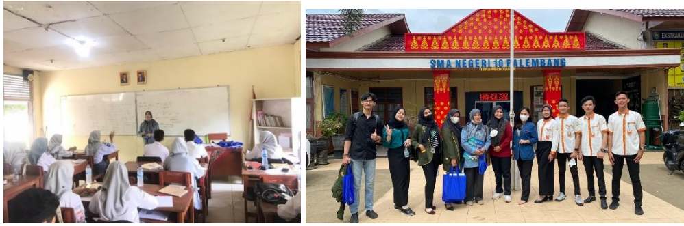
Keterangan: Ketika melakukan sosialisasi ke kelas-kelas

Dari hasil sosialisasi ke kelas jurusan IPA dan IPS, maka dapat diambil hasil repon sebagai berikut: