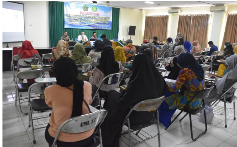
Gambar 2. Kegiatan Pendampingan