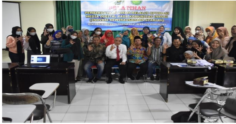
Gambar 2, Komunitas INKUSI