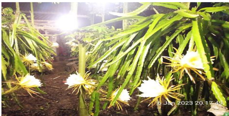
Gambar 8. Keindahan Bunga Buah Naga Yang Mekar pada Malam hari

Dampak yang diharapkan dalam pembangunan desa wisata ini, kegiatan ekonomi masyarakat dapat meningkat. Sehingga dapat menumbuhkan lapangan kerja, mengurangi kemiskinan dan pengangguran serta berdampak positif terhadap kelestarian lingkungan dan budaya asli setempat. Potensi lokal desa dapat menjadi keunikan dan kekhasan yang berbeda dengan desa lainnya sebagai identitas desa.