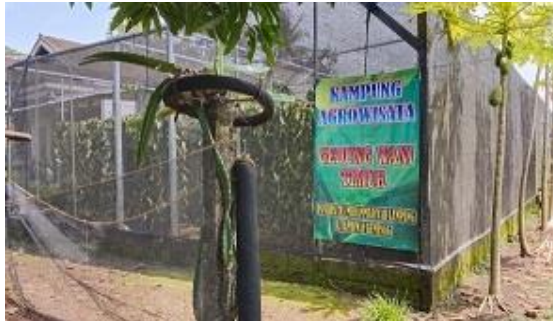
Gambar 7. Kebun Vanili

Untuk memudahkan pengunjung dari luar daerah maka perlu dibuatkan papan petunjuk arah. Papan petunjuk arah ke lokasi destinasi wisata buah naga di desa Gedung Wani Timur dapat dipasang di tempat yang strategis misalnya di pintu masuk desa. Desa Gedung Wani Timur dikelilingi oleh beberapa desa lainnya di Marga Tiga dengan demikian akses menuju ke desa tersebut sangat terbuka dan didukung infrastruktur jalan yang sudah tersedia.