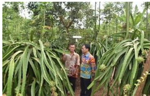
Gambar 3. Bersama dengan Anggota Pokdarwis

Sesuai dengan metode ABCD maka dalam pelaksanaan kegiatan pengabdian kepada masyarakat ini, terlebih dahulu melakukan kegiatan yang paling mudah dikerjakan dengan keberhasilan yang tinggi. Berdasarkan kesepakatan dengan mitra pengabdian khususnya Kelompok Sadar Wisata (Pokdarwis) Gewanti, maka rangkaian kegiatan diawali dengan mengadakan pelatihan bagi anggota pokdarwis atau calon penggiat desa wisata. Desa Gedung Wani Timur ini, belum pernah mendapatkan PNPM Mandiri Pariwisata sehingga anggota pokdarwis perlu meningkatkan kemampuan, pengetahuan dan kompetensi tentang desa wisata. Dalam pelaksanaan pengabdian kepada masyarakat, Pokdarwis Gewanti sebagai mitra belum banyak melakukan kegiatan terkait dengan tujuan dibentuknya Pokdarwis ini, hal ini disebabkan pengetahuan dan kemampuan anggota Pokdarwis tentang desa wisata sangat minim sehingga peningkatan wawasan dan pengetahuan tentang desa wisata menjadi prioritas utama.