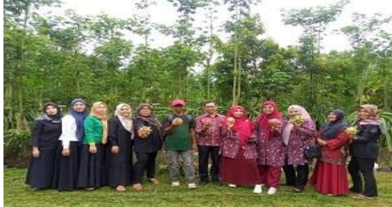
Gambar 4. Tim Dosen dan Pokdarwis Gewanti

hitam masih dijual dalam bentuk curah, pepaya california dan buah naga dijual dalam bentuk buah segar dan lainnya. Terkait dengan hal tersebut maka diperlukan pembinaan lebih lanjut terhadap UMKM untuk meningkatkan kualitas produk dan sekaligus meningkatkan ekonomi masyarakat. Untuk mendukung gerakan desa wisata maka dipandang perlu untuk merumuskan produk yang khas dan unik dari desa Gedung Wani Timur. Potensi produk lokal akan dapat dikenal bila promosi dan pengenalan terhadap desa dilakukan secara rutin. Pengunjung yang berasal dari luar daerah yang mengunjungi destinasi kebun buah naga merupakan bagian dari hasil promosi desa wisata.