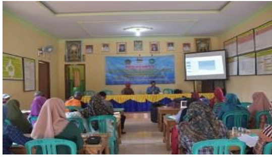
Gambar 5. Kegiatan Pelatihan di Balai Desa Gedung Wani Timur