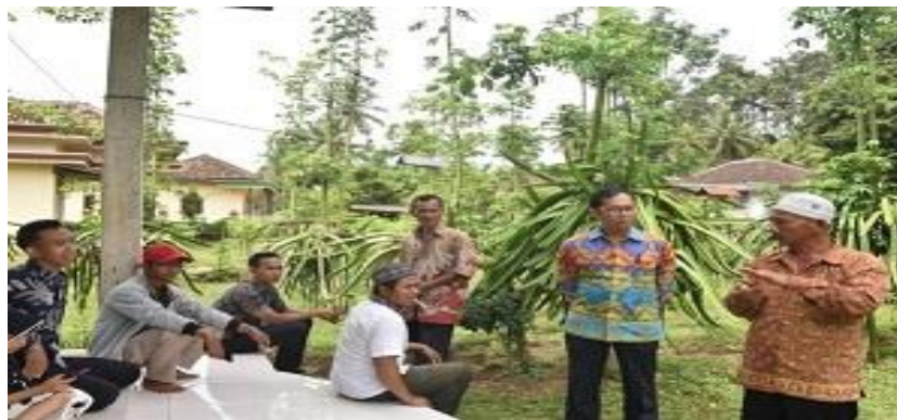
Gambar 6. Diskusi lapangan dengan Anggota Pokdarwis Gewanti

Sebagai tempat pertemuan anggota komunitas maka direncanakan untuk membuat saung/gubuk yang bisa menyatu dengan kebun buah naga. Hingga laporan ini dibuat saung/gubuk masih dalam proses pembangunan dan dilakukan oleh Pokdarwis dan penggiat desa wisata. Diharapkan dengan adanya saung atau gubuk wisata menjadi bukti keseriusan masyarakat untuk membangun desa wisata.