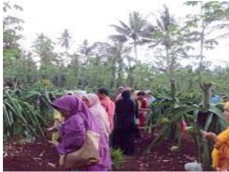
Gambar 9. Kunjungan ke kebun Buah Naga

Kunjungan dari masyarakat luar daerah untuk memetik buah naga sendiri juga sangat menarik. Walaupun bagi masyarakat desa, memetik buah naga merupakan hal yang biasa tetapi bagi masyarakat luar daerah merupakan pengalaman yang berbeda, dimana pengunjung diajarkan menggunakan alat potong untuk memetik buah naga dari pohon.