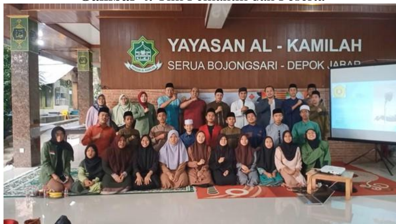
Gambar 4. Tim Pemantik dan Peserta

Langkah bagi seorang public speaker dari sisi test vokal agar memiliki suara yang enak terdengar, maka perlu ada latihan dengan beberapa tahapan/step: