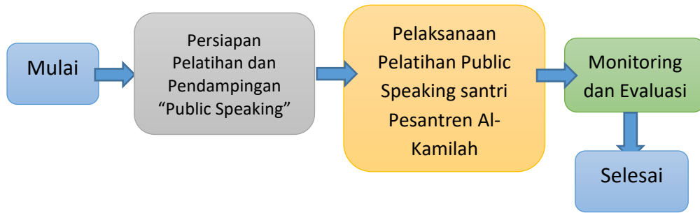
Gambar 1. Diagram Alir pelatihan Public Speaking