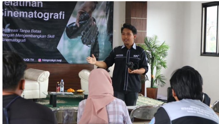
Gambar.4 Pelatihan praktik videografi

Selama enam jam peserta dilatih untuk mampu menguasai cara mengemas fragmen pada tiap potongan scene yang terserak untuk kemudian dikemas menjadi satu video yang utuh dan menarik. Para peserta sudah melakukan praktek dengan baik, dan banyak belajar dari kegiatan singkat dari pengabdian kepada masyarakat. Melalui testimoni yang disampaikan oleh peserta pelatihan, mereka mendapatkan pengalaman dan pengetahuan baru tentang etika komunikasi pada media masa dan hukum serta bijak dalam media sosial. Serta tertarik untuk terus mendalami keterampilan dalam mengemas konten yang memiliki nilai edukasi.