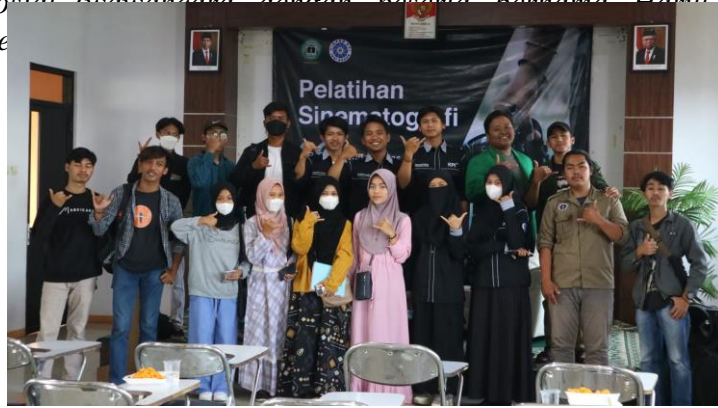
Gambar.5 Para peserta berpose selesai pelatihan

“Saya kan awam banget ya dalam hal video dan foto, setelah saya ikut ini jadi tahu, intruksi yang diperintahkan mudah dipahami ga bertele-tele dan bisa langsung dipraktikkan. Objek yang dijadikan bahan praktek nya pun sangat saya sukai, menambah wawasan saya soal konten kreator yang sekaligus berorientasi sosial” (wawancara dengan peserta bernama Harul Aini. 23 Se