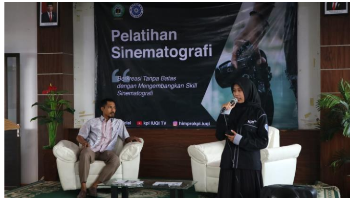
Gambar.3 Pengabdian bersama moderator pada sesi diskusi

seputar etika media masa, bahaya konten non-edukatif. Sedangkan pada sesi kedua, sesi pelatihan videografi dan video editing dilaksanakan selama 6 jam. Selama kegiatan pengabdian kepada masyarakat berlangsung antusias para peserta sangat tinggi, begitu juga dengan keterlibatan dalam praktiknya.