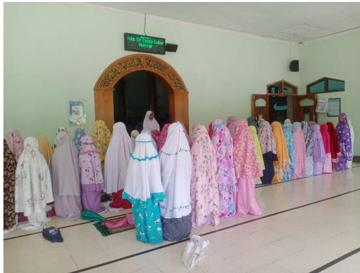
Gambar 1. Sholat dhuha berjamaah

MI Nurussalam. Hal ini juga bertujuan untuk meningkatkan spiritualitas dan membentuk moralitas yang baik para siswa/i.