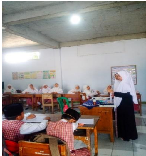
Gambar 2. Sosialisasi Penelitian

Pemberikan soal pre-test guna untuk mengukur kemampuan siswa/i dalam memahami pembelajaran akidah akhlak dengan metode yang sudah berlangsung selama pembelajaran. Selain itu soal pre-test juga bertujuan untuk mengukur implementasi pembelajaran akidah akhlak di kehidupan sehari-hari. Diagram dibawah ini menunjukkan hasil presentase hasil pre-test yang dilakukan.