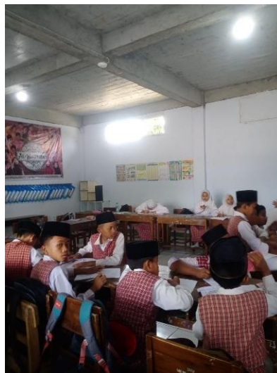
Gambar 4. Suasana Kelas

Ditinjau berdasarkan hasil pre-test banyak anak yang belum memahami dengan baik adanya pembelajaran akidah akhlak dan cara implementasinya pada kehidupan sehari-hari. Artinya, metode pembelajaran yang diterapkan di dalam kelas belum mencapai tujuan secara maksimal. Oleh karena itu perlu adanya pengembangan metode pembelajaran akidah akhlak agar siswa/i dapat mengimplementasikan di luar sekolah.