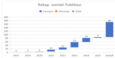
Rekap Jumlah Publish Artikel

Rekap jumlah paper atau artikel Tema Bisnis Digital pada masa 2015 - 2025