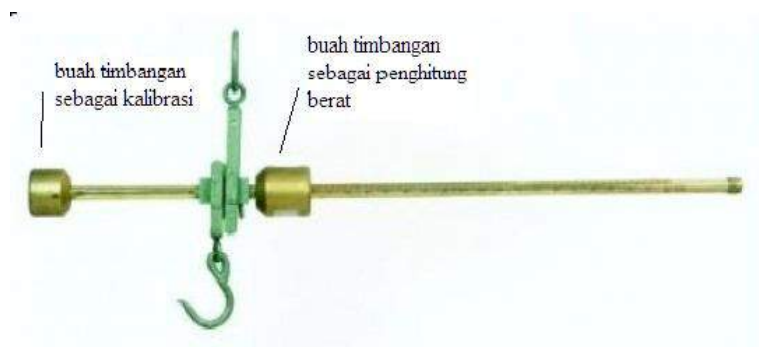
Gambar.4.3 Timbangan Stick (Timbangan gantung)

Gambar timbangan yang sering dipakai oleh pembeli karet adalah sebagai berikut: