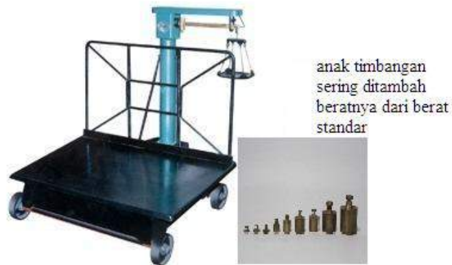
Gambar.4.4 Timbangan Duduk

Demikian gambaran realita yang terjadi di dalam transaksi jual-beli karet di desa Betung. Praktek permainan harga itulah yang akan ditinjau dari segi fiqh muamalah. Allah SWT, telah menjadikan manusia masing-masing saling membutuhkan satu sama lain, supaya mereka tolong menolong, tukar menukar keperluan dalam segala urusan kepentingan hidup masing-masing, baik dengan jalan jual beli, sewa menyewa, bercocok tanam, atau perusahaan yang lain, baik dalam urusan kepentingan sendiri maupun untuk kemaslahatan umum.